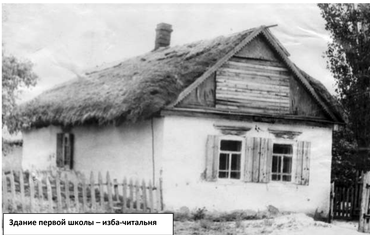
Здание первой школы – изба-читальня