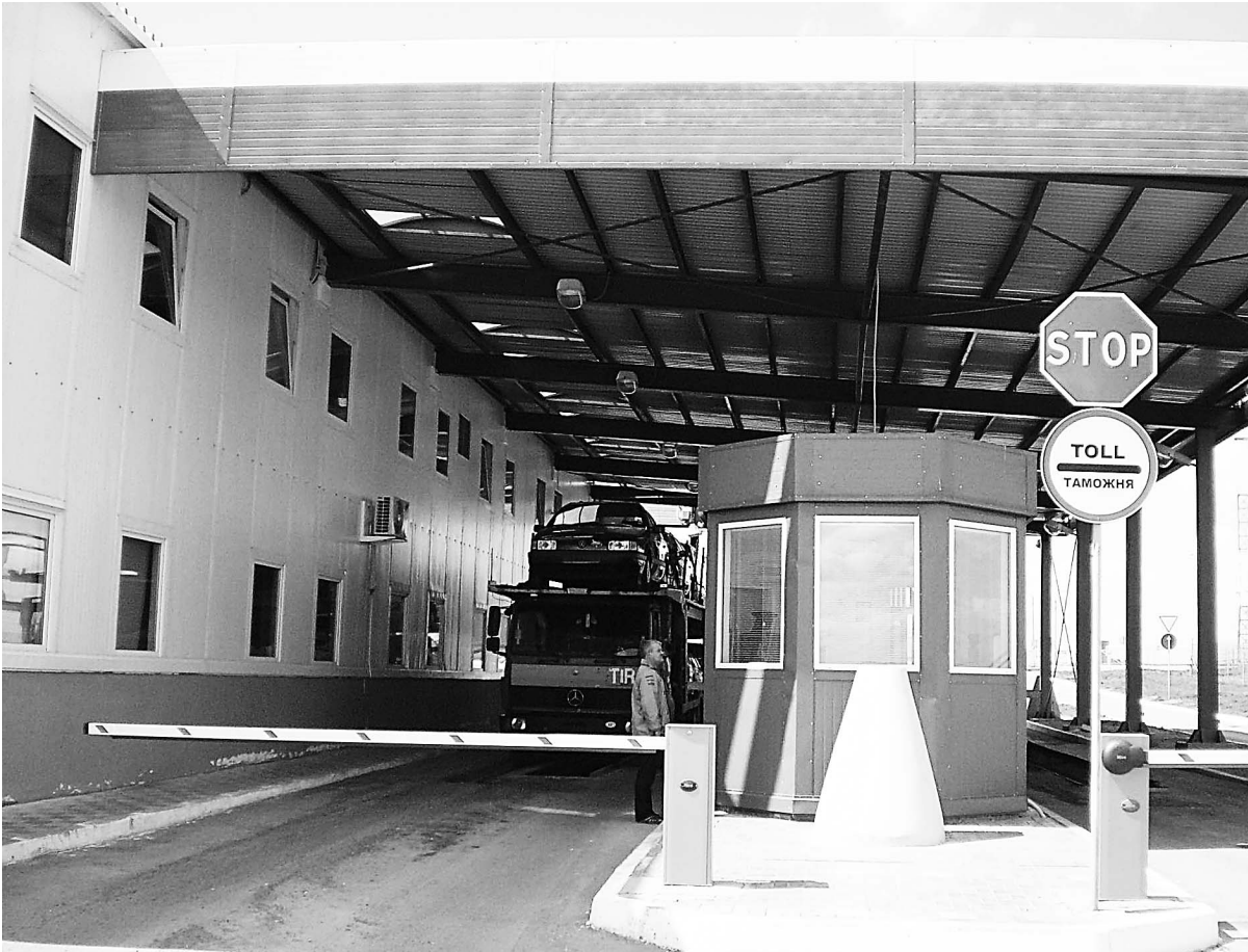
Таможенный пост на пограничном пункте пропуска в Озинках прекратил работу 1 июля