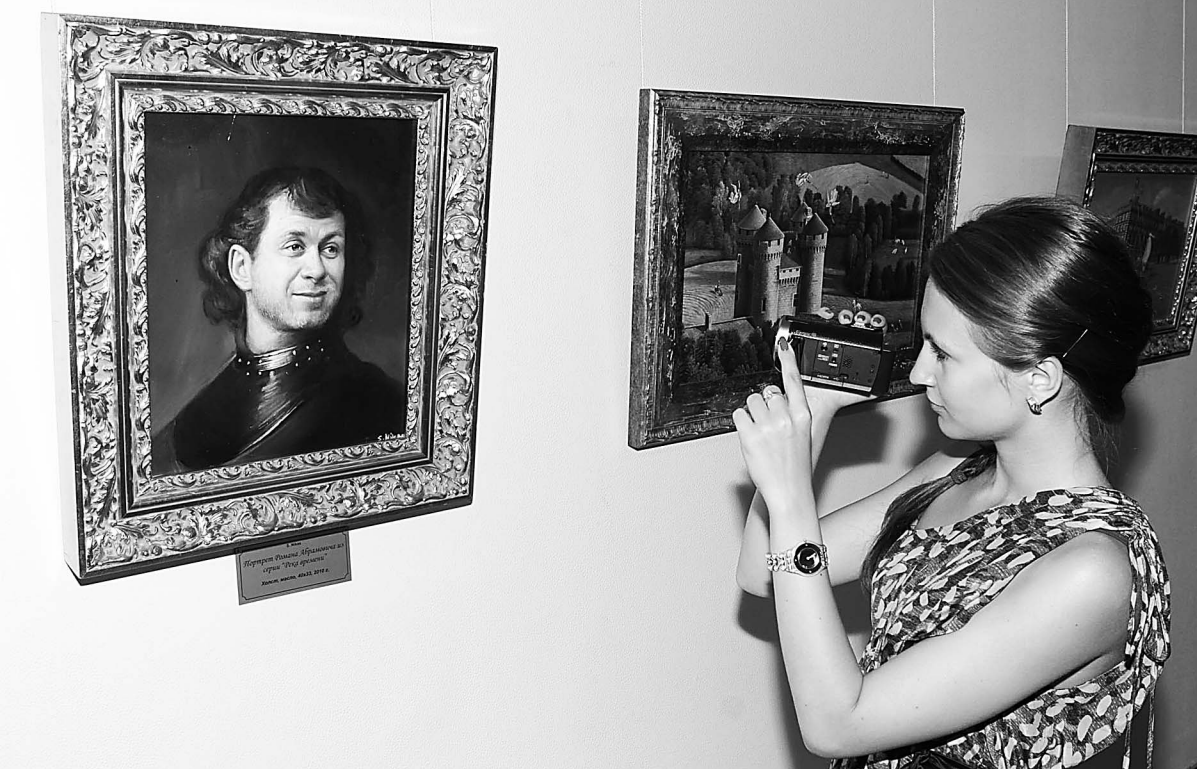
Не пытайтесь вспомнить, кто перед вами. Автор позаботился об этом сам.

Рассмотрим метафоры Сафронова. «Ломоносов в кресле». У великого русского ученого нет лица – вместо него небесный пейзаж, сквозь кото-