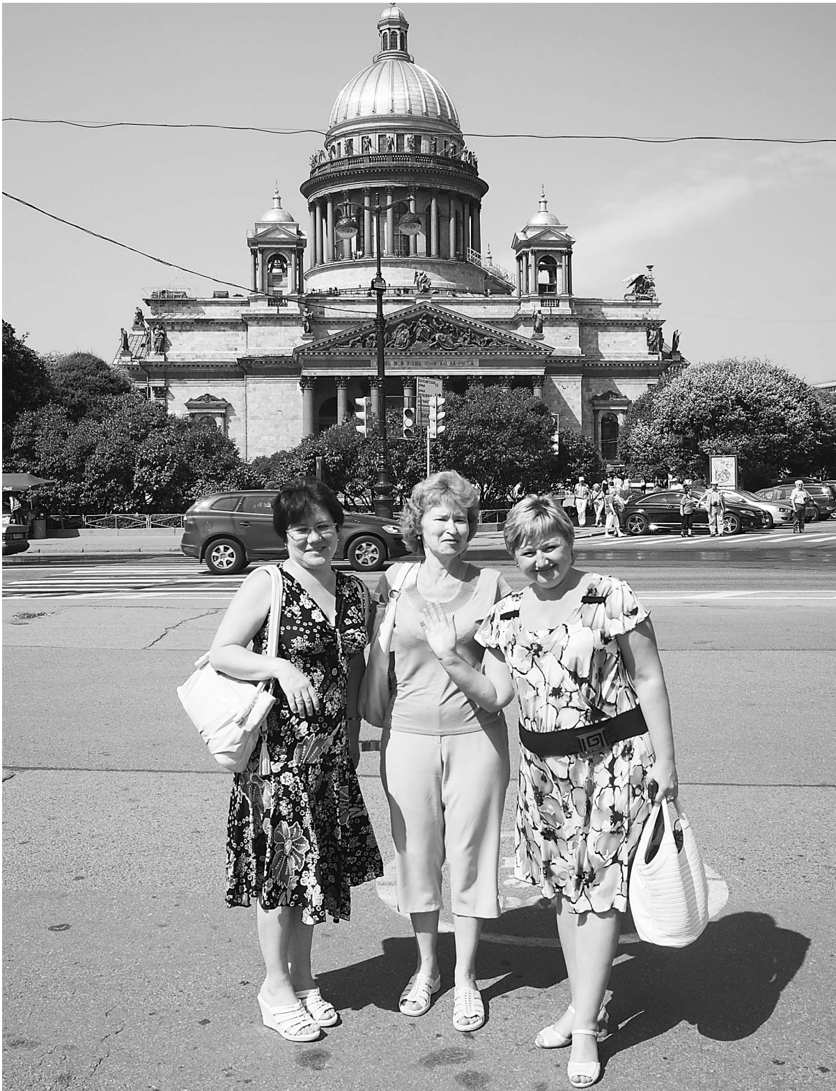
Классные руководители увезли из Питера много фотографий и впечатлений.

Лучшие педагоги области побывали в Санкт-Петербурге