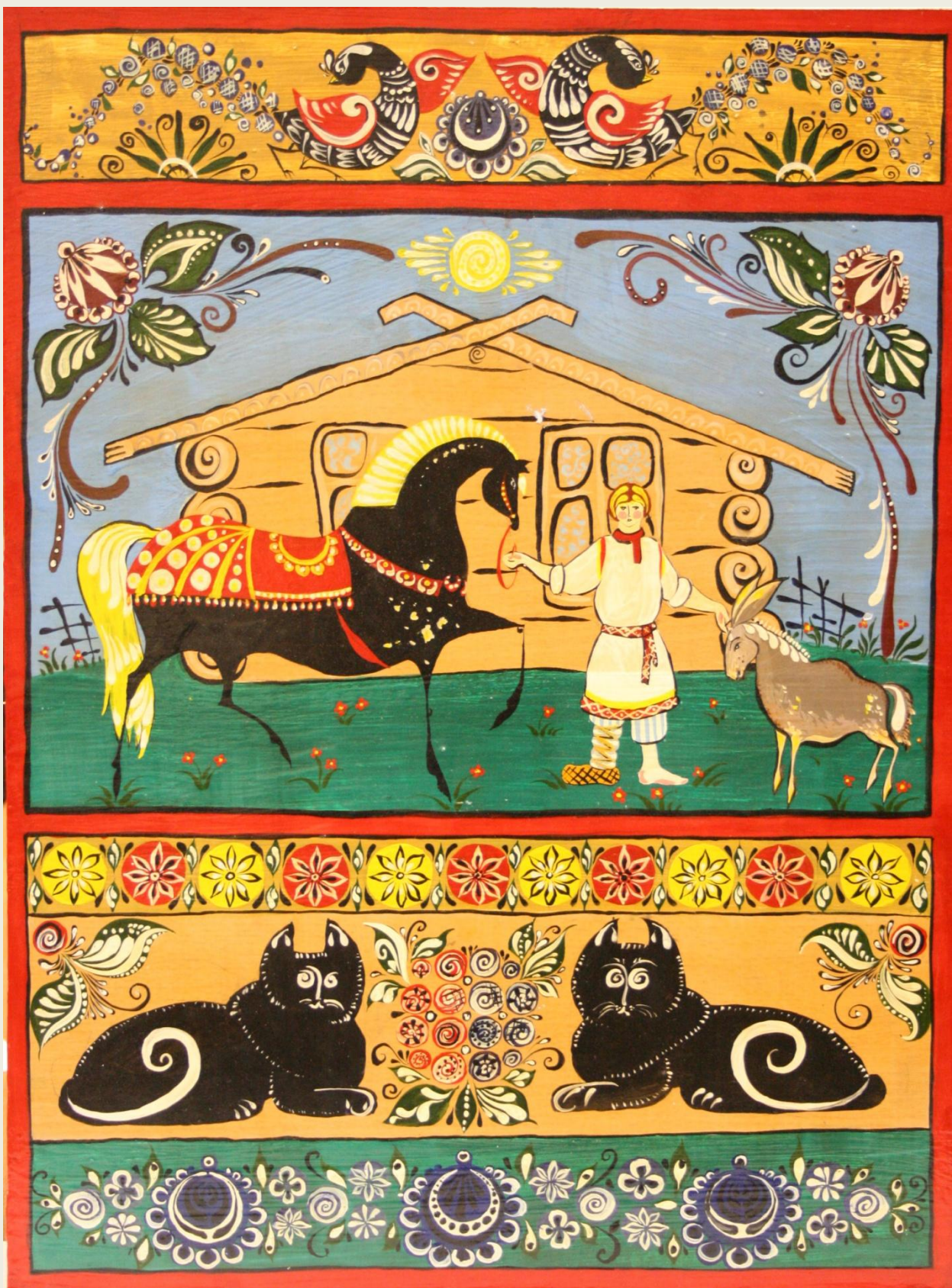
1. Поберей Тамара «Конек-Горбунок» Городецкая роспись.