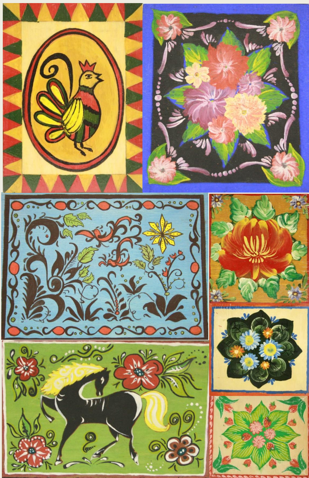
5. Упражнения по Волховской, Городецкой, Пермогорской росписи.