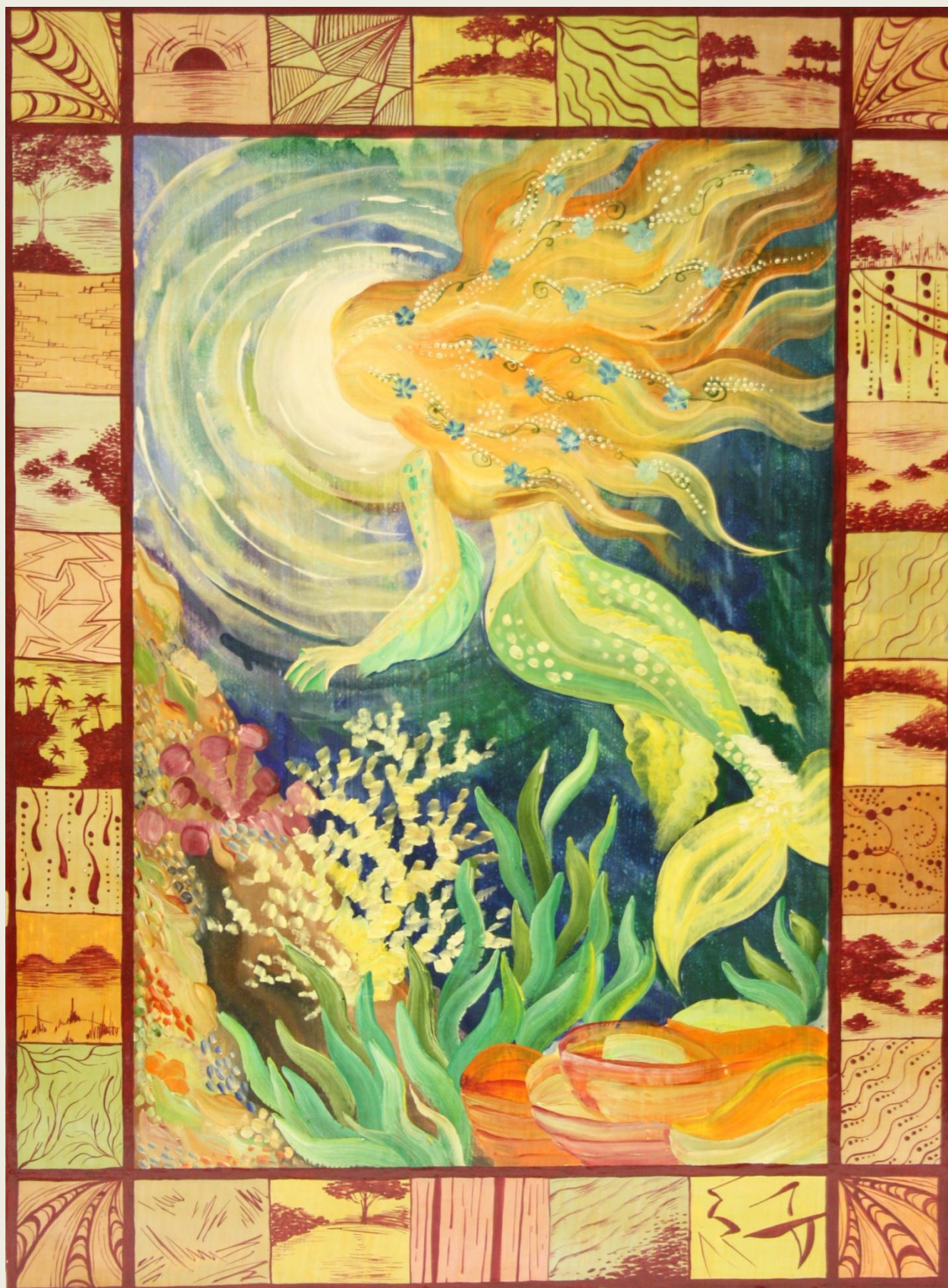
3. Куцобина Дарья «Русалочка» Волховская роспись.