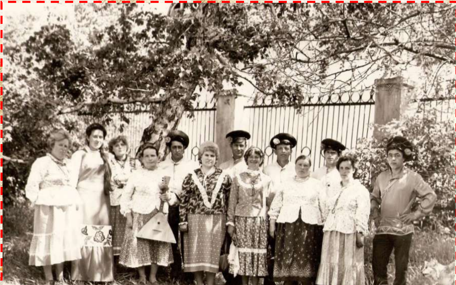
Фестиваль. «Кадиночка» Иркутск 1986 год.