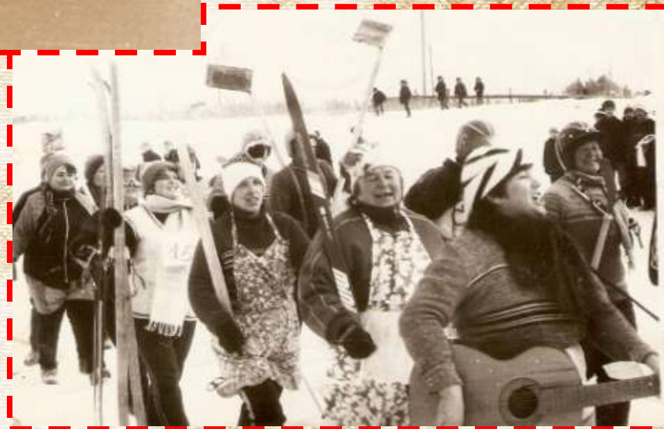
Зимняя районная спартакиада село Усть-Када «С песней на лыжах» 1980 год