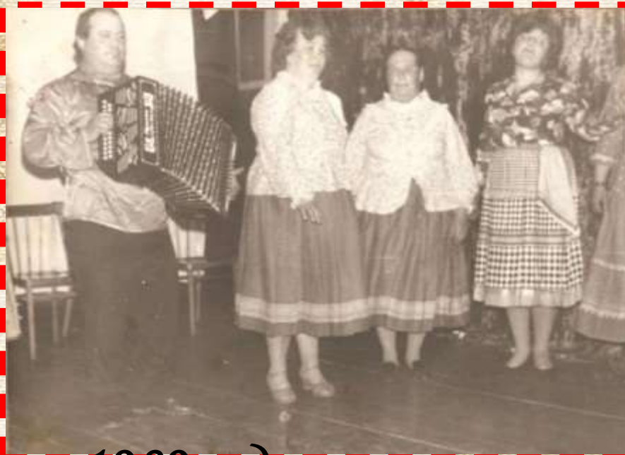
«Масленицы» 1989 год.