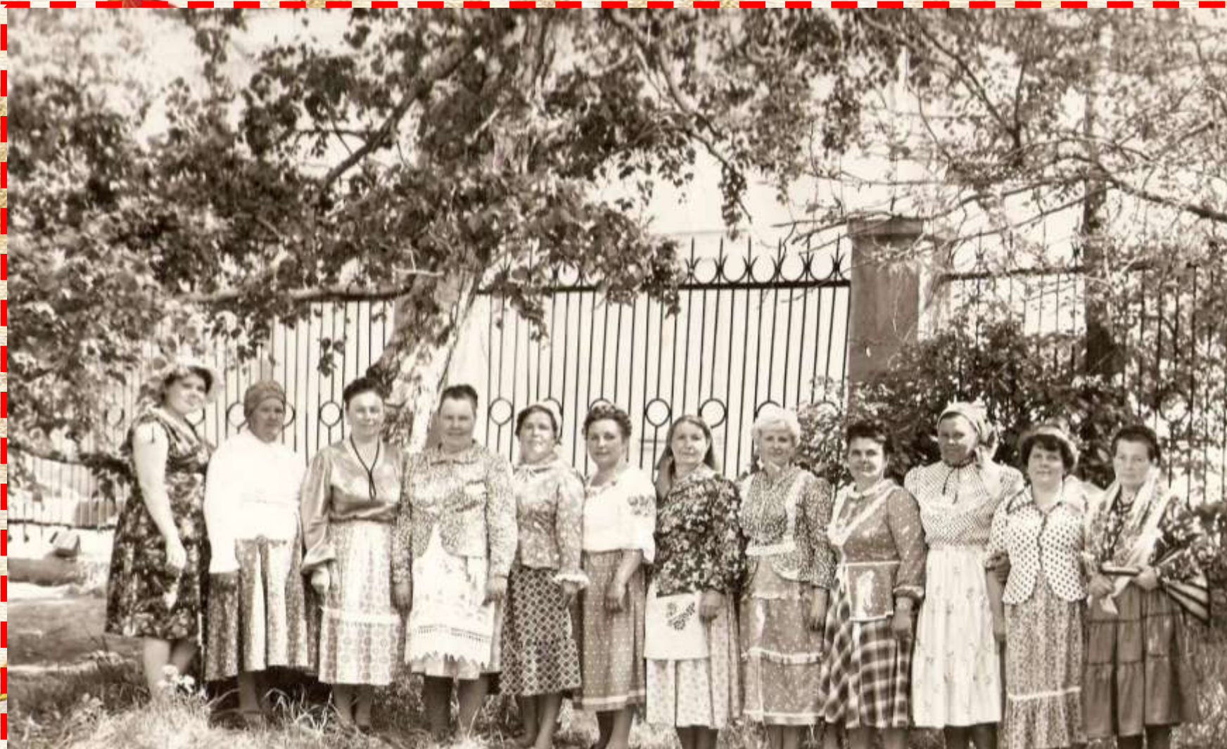
Фестиваль Иркутск 1986 Куделечки.