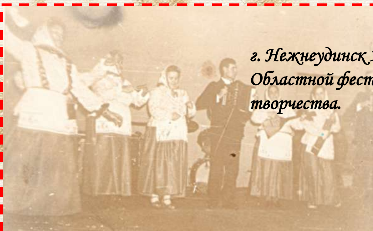
г. Нежнеудинск 1992 год Областной фестиваль народного творчества.