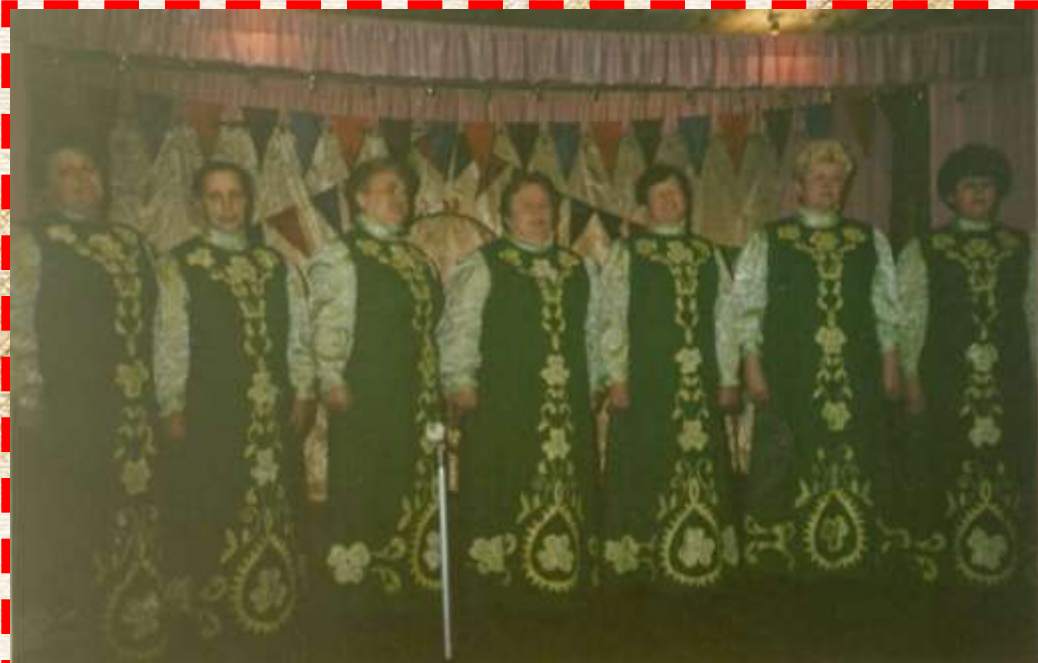
Смотр художественной самодетельности 2000 год