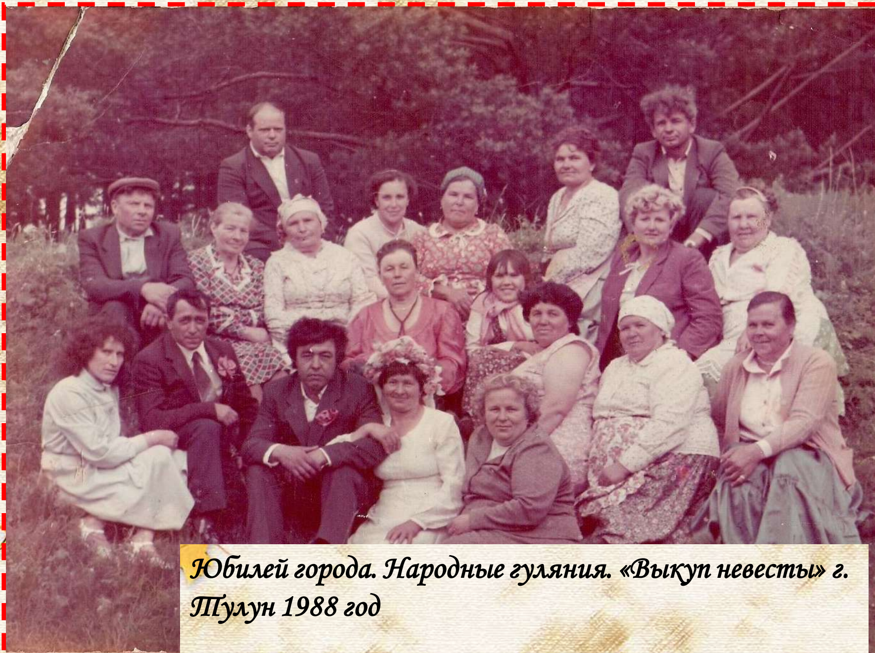
Юбилей города. Народные гуляния. «Выкуп невесты» г. Пулу 1988 год