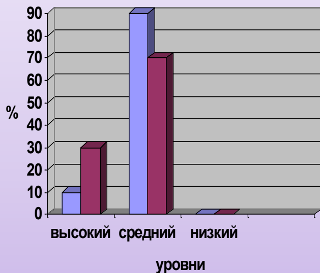
Сравнительная диаграмма уровня сформированности общетрудовых умений и навыков