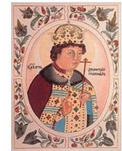
Дмитрий Иванович 1552—1553