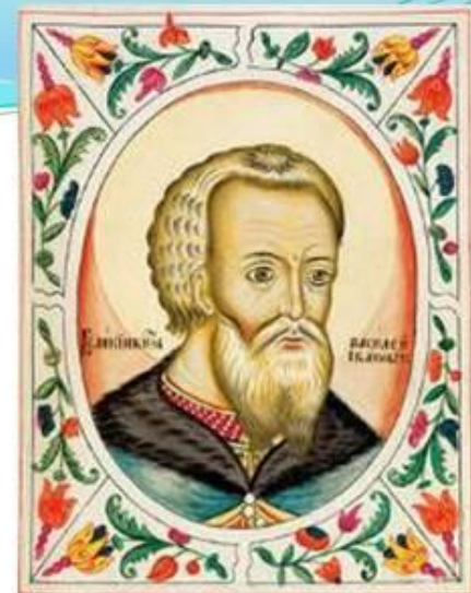
Великий московский князь 1505 - 1533