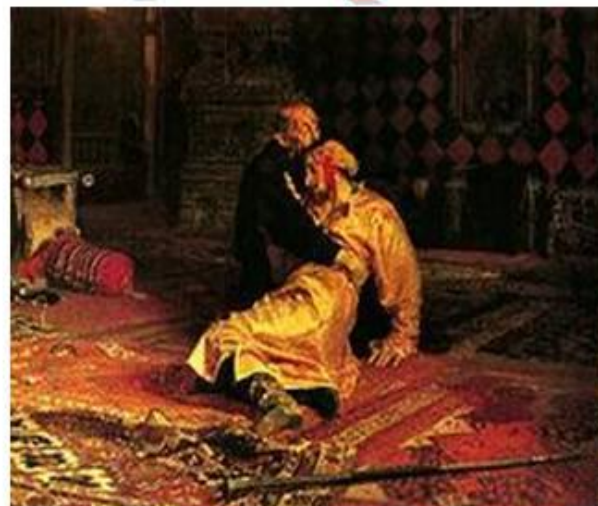
Иван Иванович 1554-1581