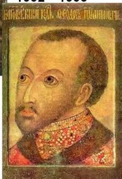
Фёдор I Иоаннович 1584 - 1598