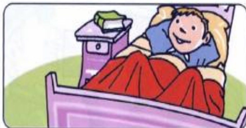
Juan _____ en la cama.