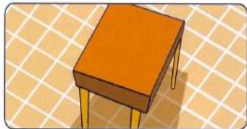
La mesa es cuadrada.