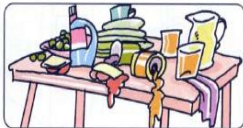
La mesa está sucia.