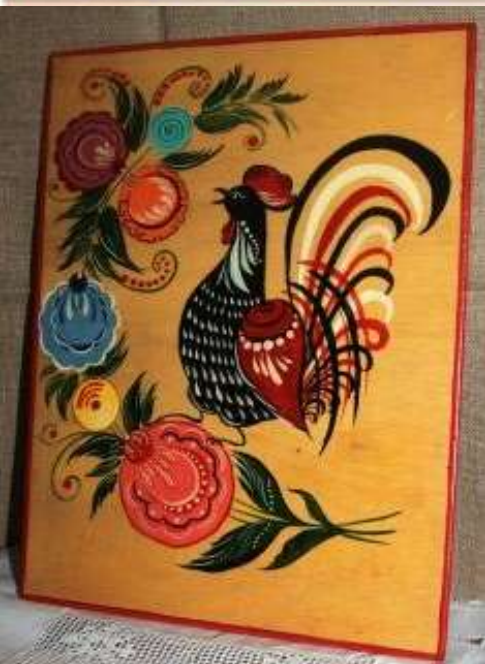
Гордиенко В. Панно