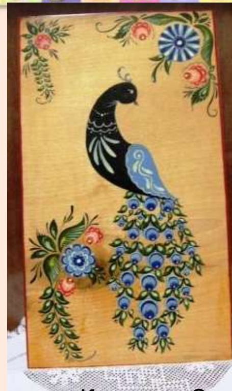
Кочетова Э. ЖАР-ПТИЦА