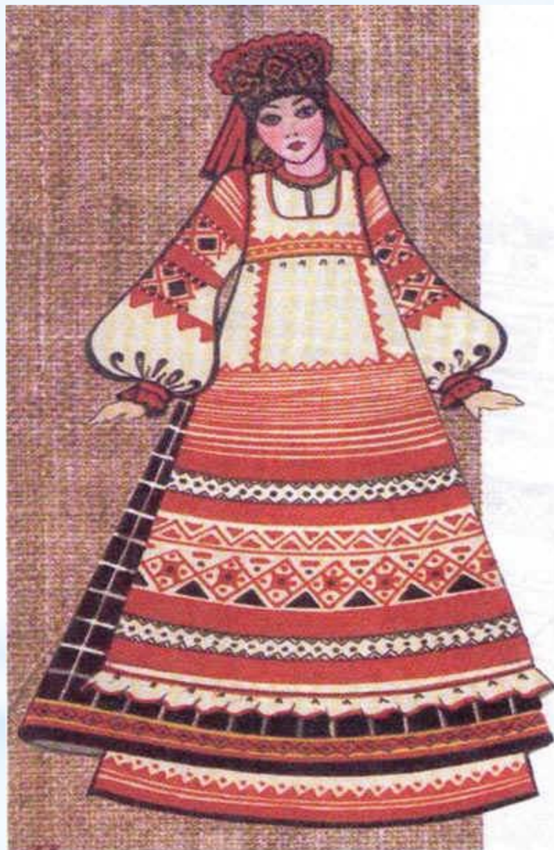
ПРАЗДНИЧНЫЙ ДЕВИЧИЙ КОСТЮМ. (ПЕРЕДНИК)