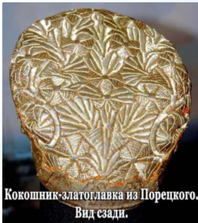
Кокошник-златолавка из Порецкого. Вид сзади.