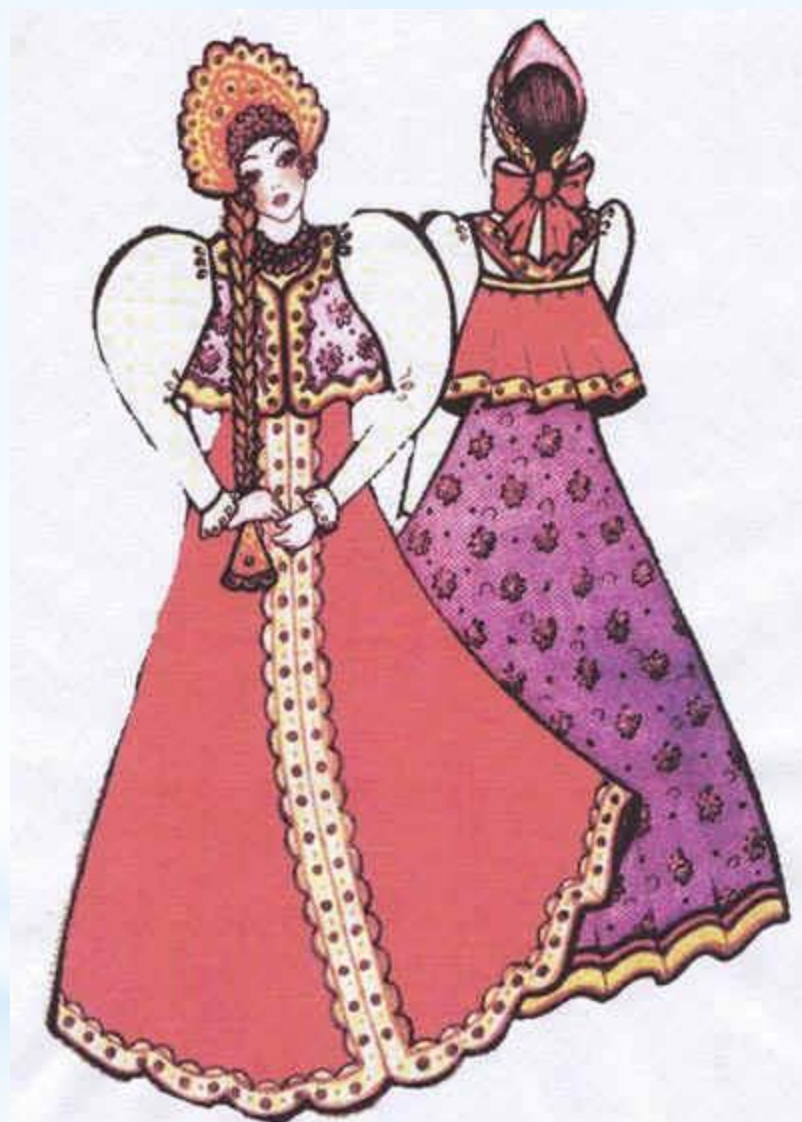
ЛЕТНИЙ ДЕВИЧИЙ КОСТЮМ (ЕПАНЕЧКИ)