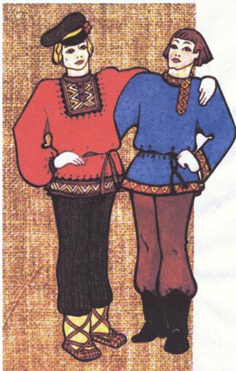
МУЖСКОЙ КРЕСТЬЯНСКИЙ КОСТЮМ (РУБАХА И ПОРТЫ)