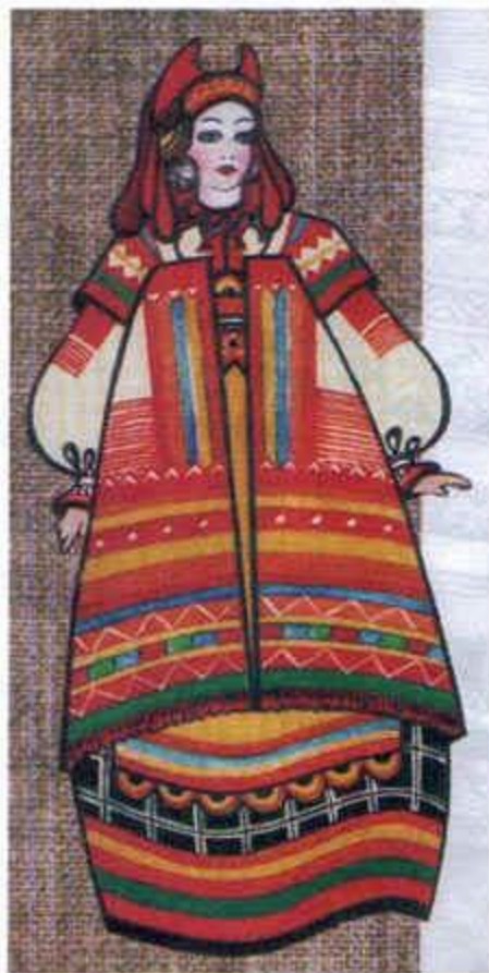
КОСТЮМ ЗАМУЖНЕЙ ЖЕНЩИНЫ. (НАВЕРШНИК)