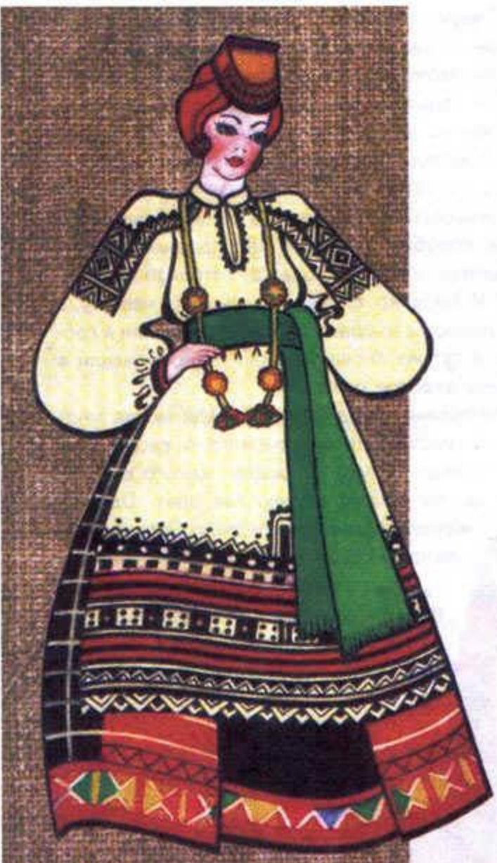
ЮЖНОРУССКИЙ ЖЕНСКИЙ КОСТЮМ (ПОНЕВА)