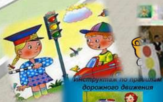
Инструктаж по правилам дорожного движения

Опыт развитых Западных стран говорит о том, что в целом аварийность можно снизить только комплексными мерами. По специальной программе, такими как пропаганда безопасности дорожного движения в школах и детских садах, ужесточением наказания за нарушения ПДД, повышением качества обучения в автошколах, улучшением дорожного покрытия, усовершенствованием организации дорожного движения и многими другими мерами позволяющими достичь существенного снижения общего количества ДТП и тяжких последствий от них.