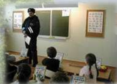
Игра «Ты пешеход»