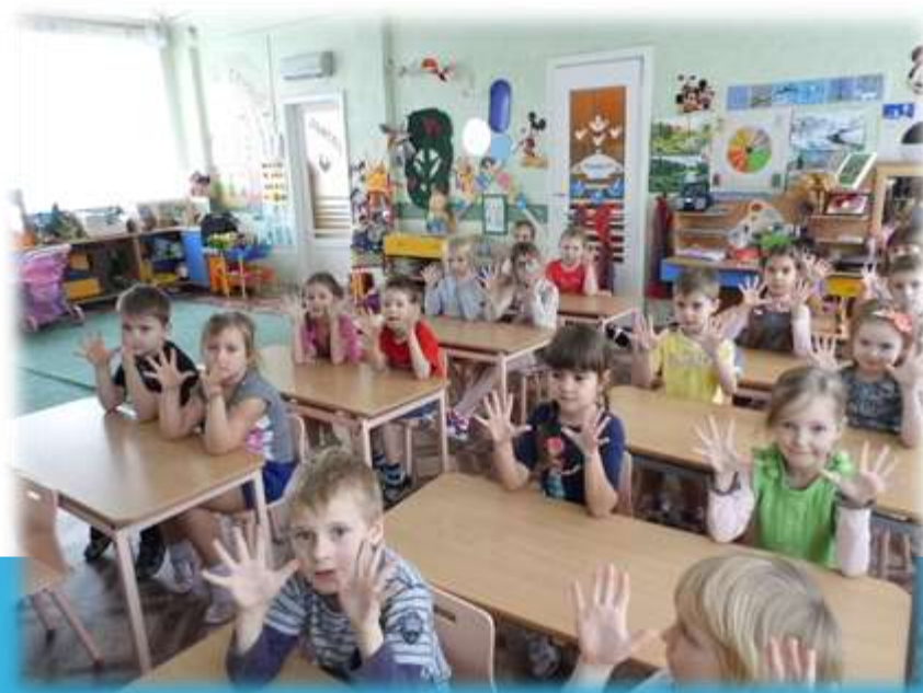
Пальчиковая гимнастика «солнышко, заборчик, камешки»