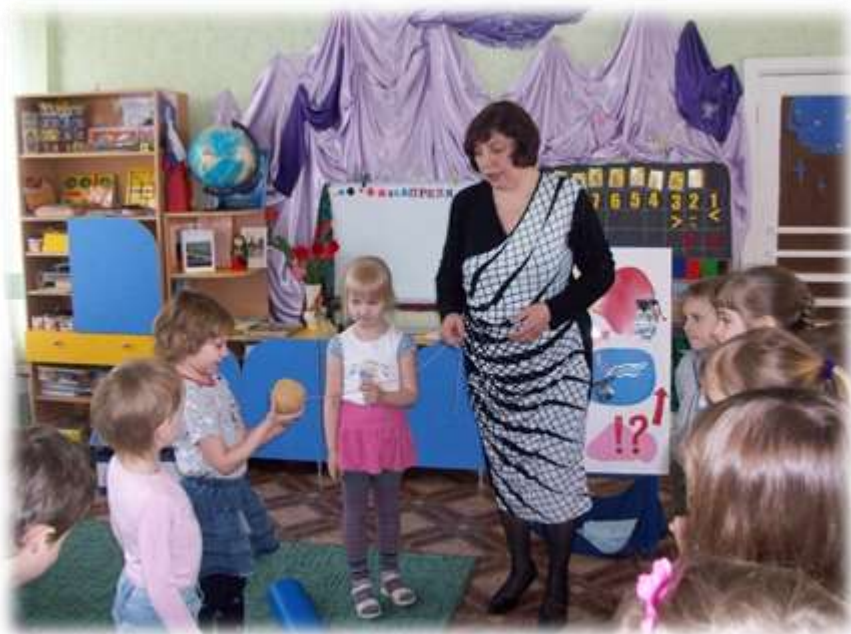
Дидактическая игра «волшебное слово»