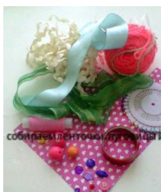
собираем ленточки и бусинки