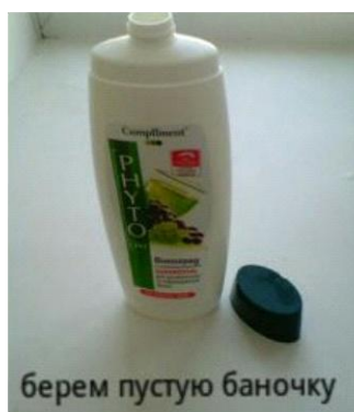
берем пустую баночку