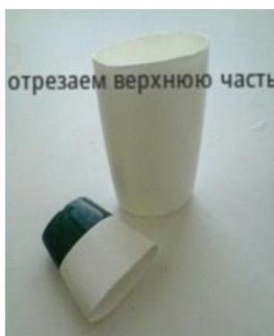
отрезаем верхнюю часть