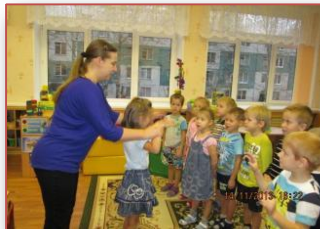
Мы с мамой дирижеры хора