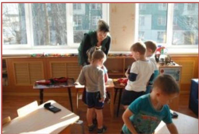
Мама продавец деталей для машин