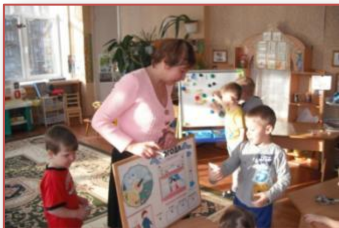
Моя бабушка синоптик