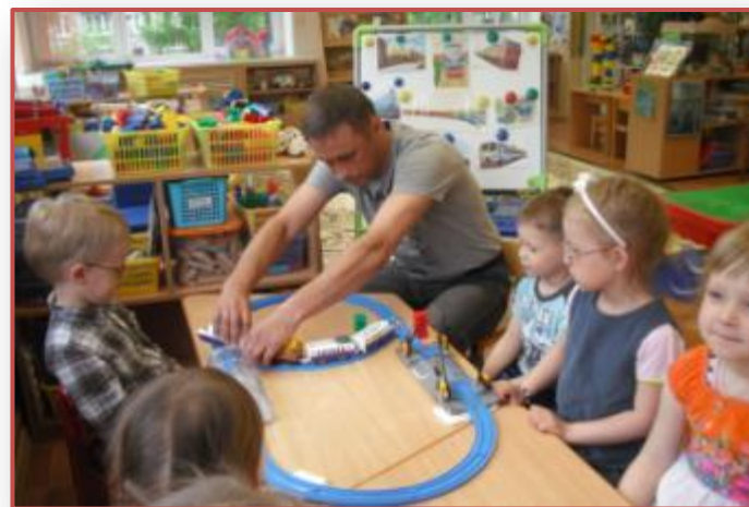
Мы любим играть с папой