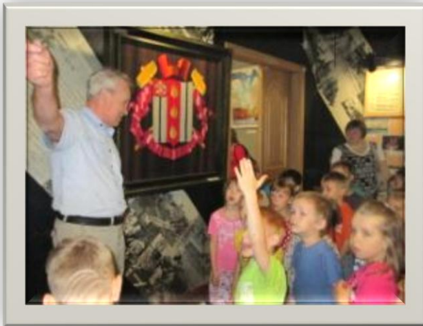
Музей Ижорского завода