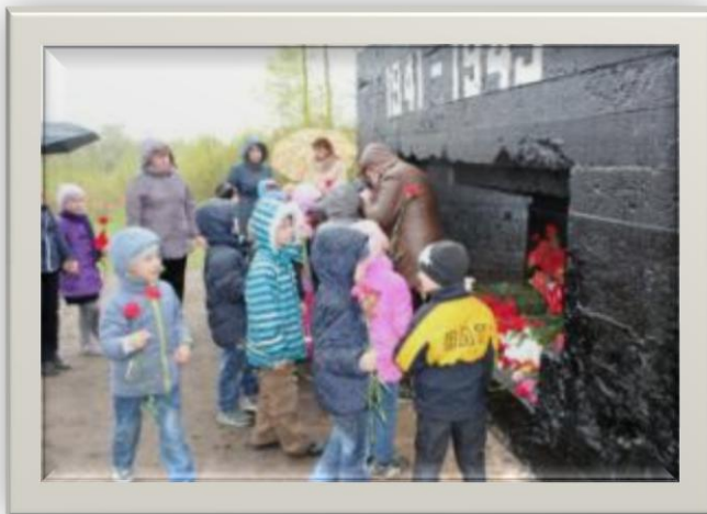
Возложение цветов защитникам Родины