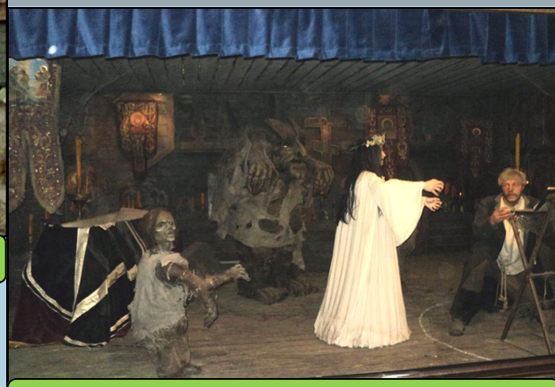
Движущиеся декорации к фильму «Вий»