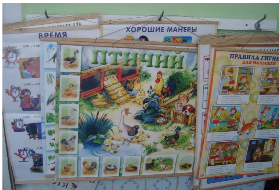
Картины и плакаты