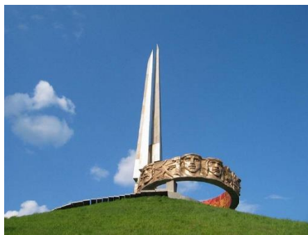
Обелиск на вершине Кургана Славы.