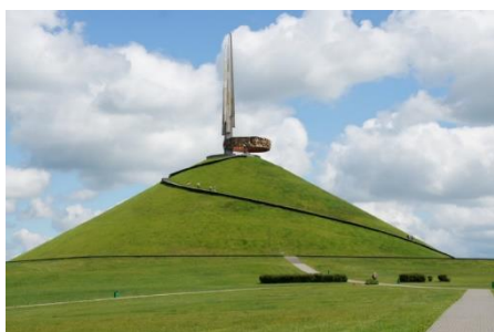
Курган Славы, возведен в 1969 г.

На подъезде к Минску расположен один из самых красивых и величественных памятников героям Великой Отечественной войны - «Курган Славы». Он расположен в месте где в 1944 году в результате операции «Багратион» было взято в окружение более 100 тысяч немецких солдат и офицеров в так называемом «Минском котле». На этом месте в 1969 г был насыпан огромный курган, на вершине которого установили обелиск. Общая высота всего памятника – 70 метров.