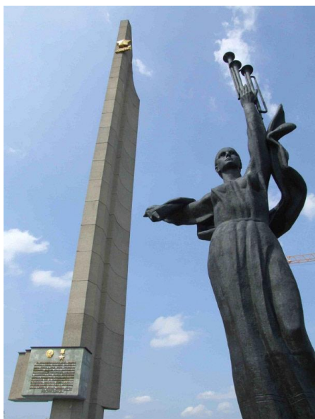
Скульптура "Родина - мать" у основания обелиска.

В 1985 г, в честь 40-летия Победы в Минске, на проспекте Победителей был установлен 45-метровый бетонный обелиск «Город-герой». У его подножия расположен бронзовый монумент «Родина-мать», в виде женщины, высоко поднявшей над головой фанфары Победы.