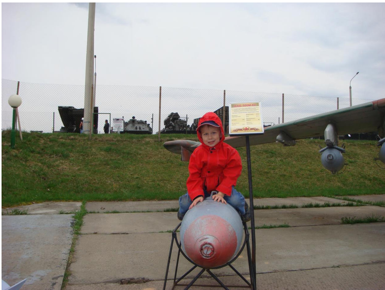
Вторая выставочная площадка целиком отдана колесной и гусеничной технике - танки, БТР, БМП и прочее мобильное вооружение.