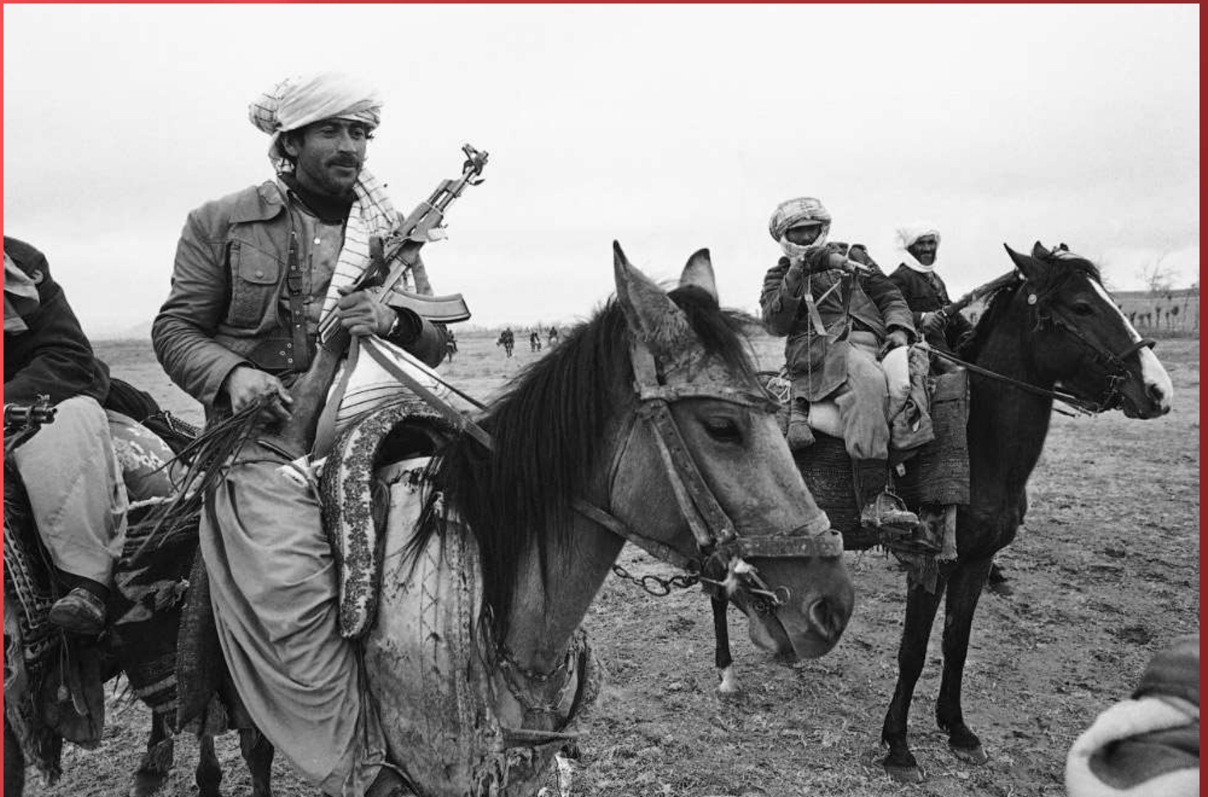
Мусульманские повстанцы с АК-47, 15 февраля 1980. Несмотря на присутствие советских и афганских правительственных войск, повстанцы патрулировали горные хребты вдоль афганской границы с Ираном.