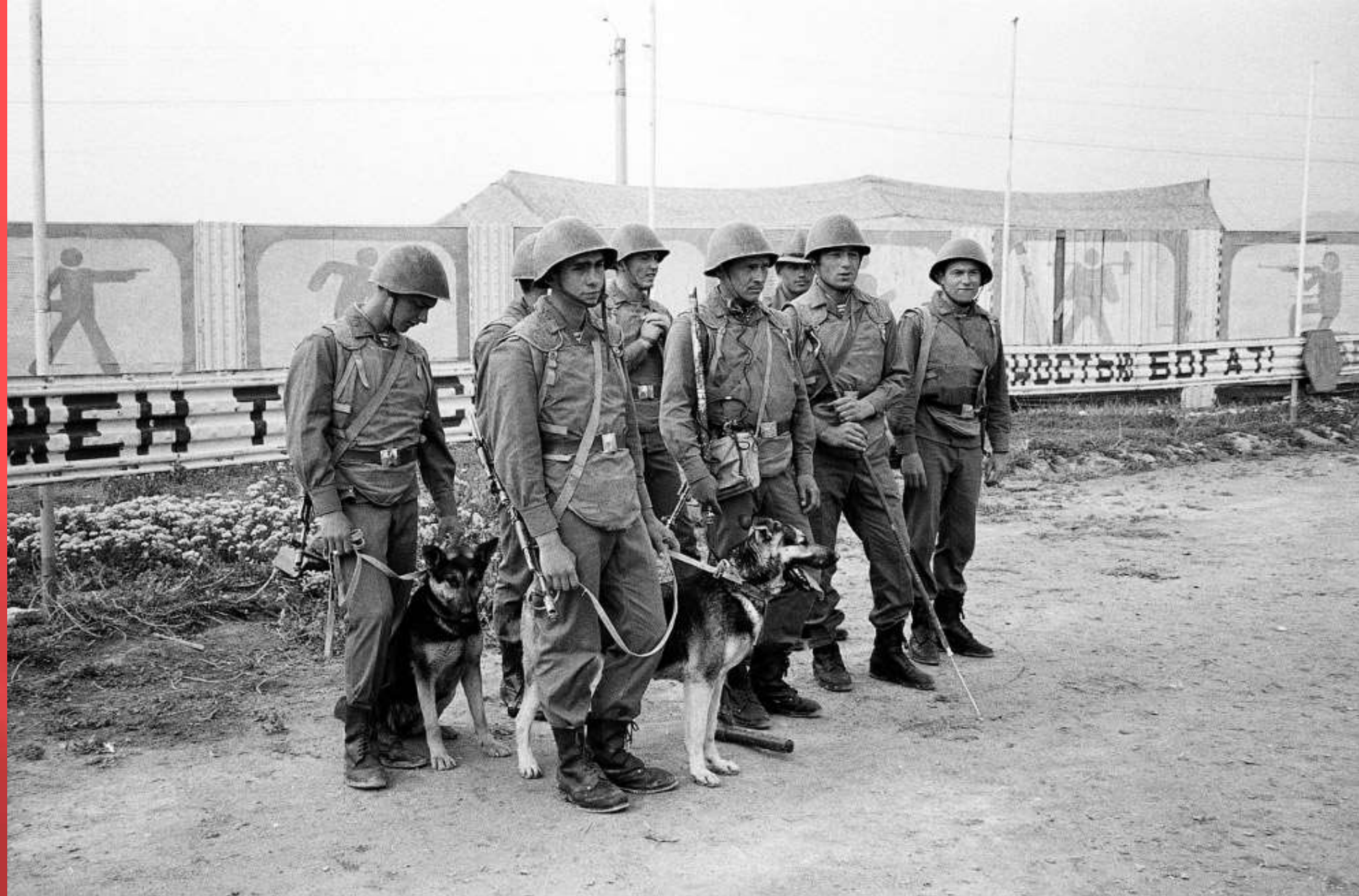
Советские солдаты с немецкими овчарками, обученными находить мины, Кабул 1 мая 1988.