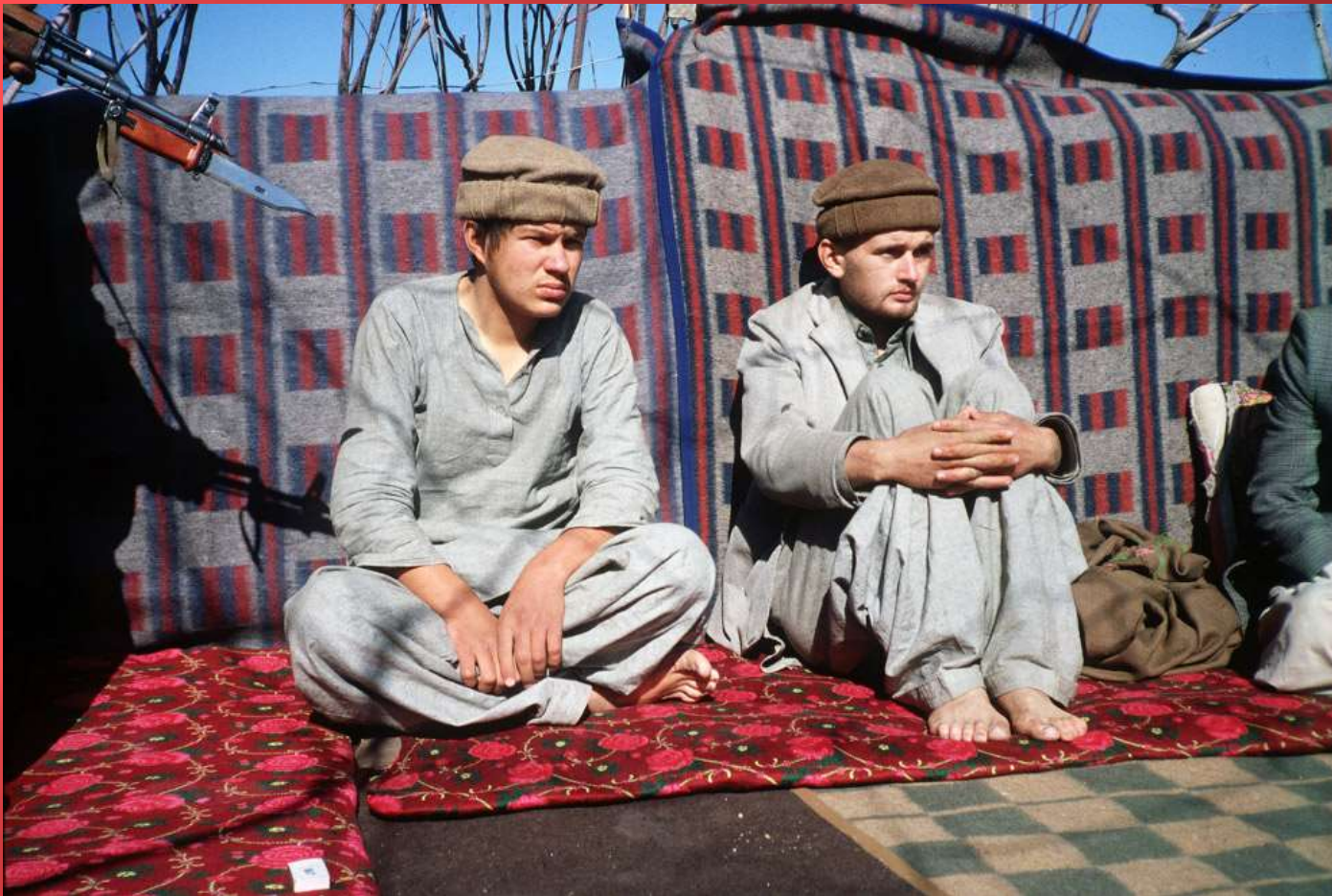
Два советских солдата, взятых в плен.: