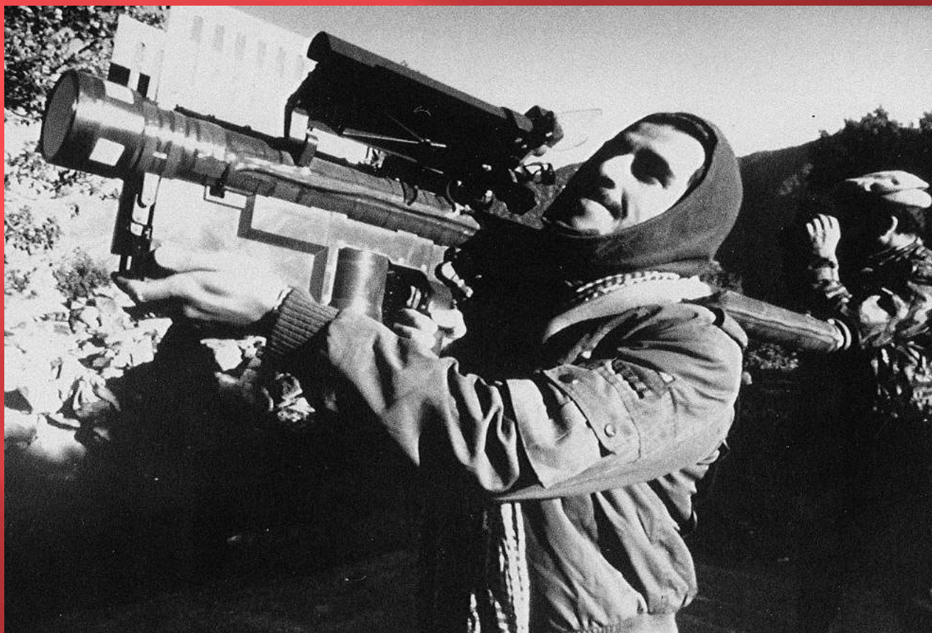
Афганский партизан с американским переносным зенитно-ракетным комплексом Стингер, 1987 год.