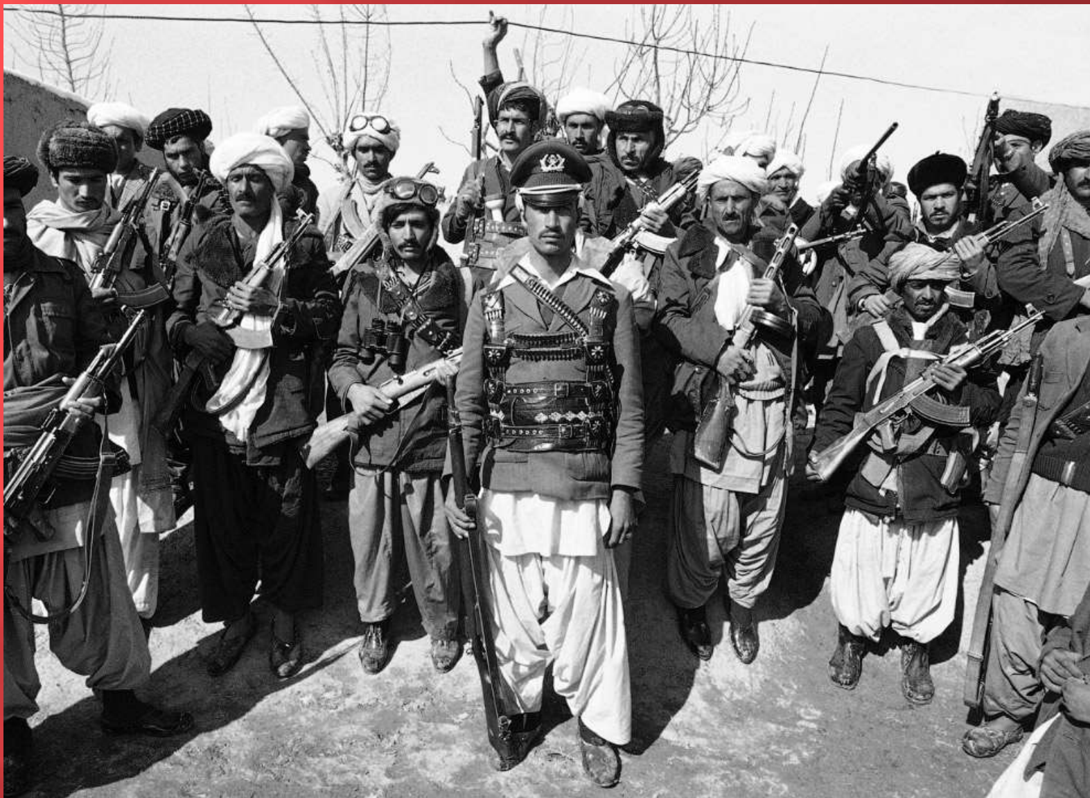
Моджахеды. Герат, Афганистан, 28 февраля 1980.