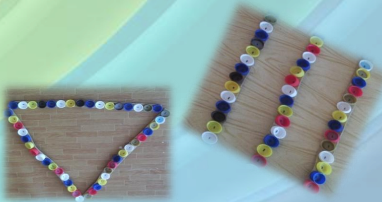
Ручеёк из цветных пробок