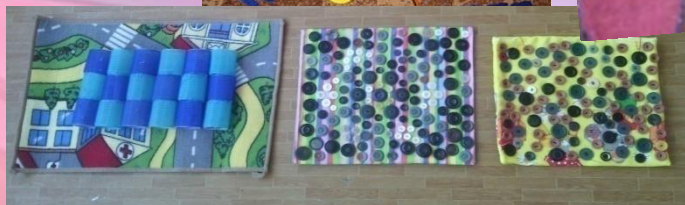
Дорожки для ходьбы