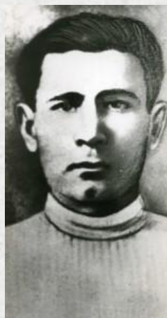
Командир отделения связи 3-й батареи 923-го артиллерийского полка