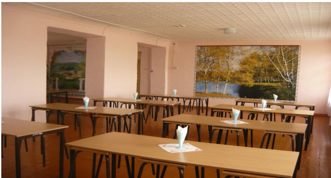
(рис.1. Школьная столовая)

Реализация продукции : Сельскохозяйственная продукция, полученная с пришкольного опытного участка идет на укрепление материально-технической базы школы и на обеспечение сельскохозяйственными продуктами школьной столовой.