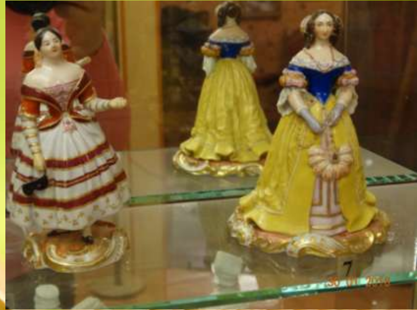
Дама с полумаской

Грампластинка «Незнакомка», выпущенная к 100 летию Со дня рождения А.А. Блока.