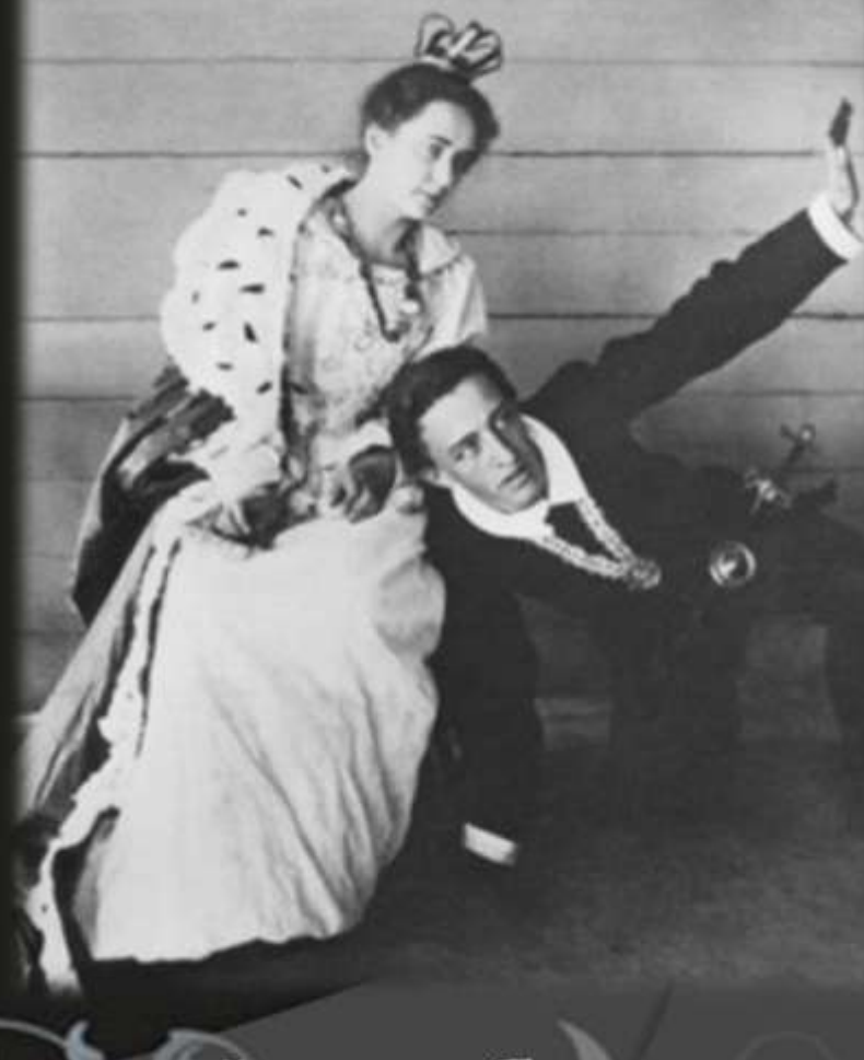
Домашний театр Гамлет

Зима 1897г. Блок мечтает стать актером, он увлечен игрой В. П. Далматова и М. А. Дальского, занимается декламацией и мелодекламацией, участвует в любительских спектаклях. Изучает роль Ромео. Декламирует стихи А. А. Фета, А. К. Толстого, Я. П. Полонского, А. Н. Апухтина.