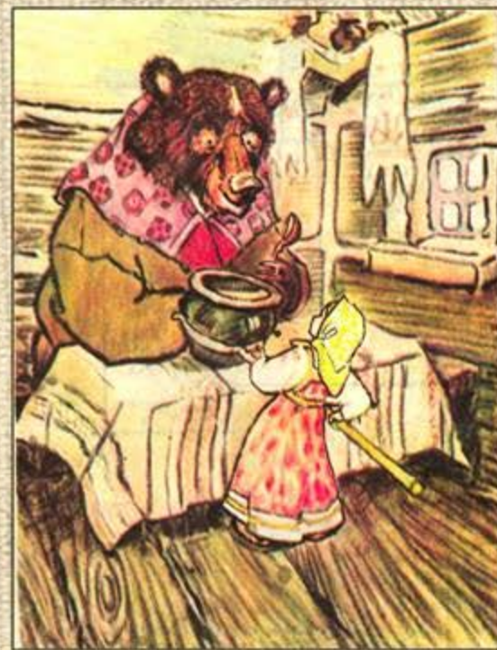
Е.М.Рачёв. Иллюстрации к сказке “Маша и Медведь”