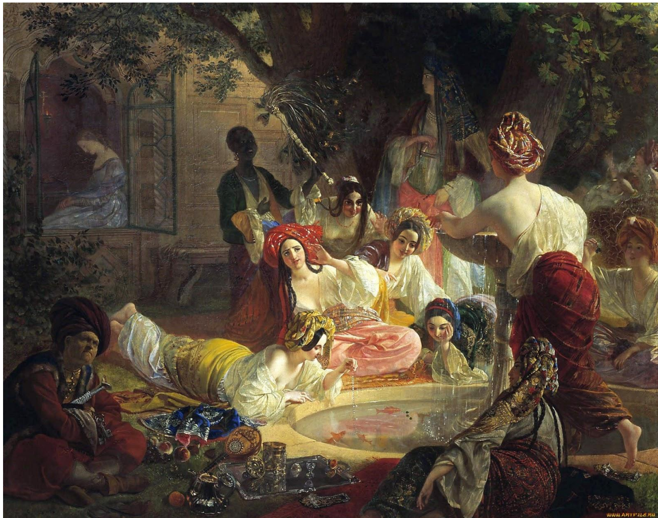
Карл Брюллов. Бахчисарайский фонтан