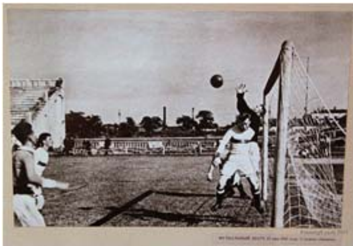
Фрагмент «Матча смерти» 31.05.1942