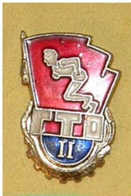
ГТО 2 степени