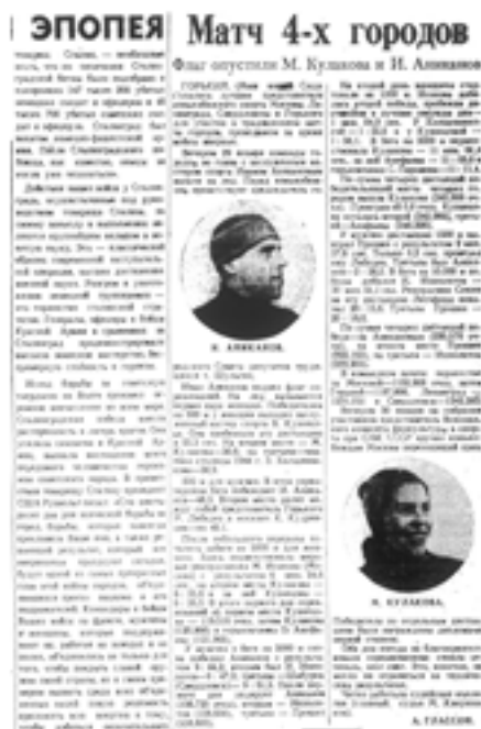
Матч 4-х городов