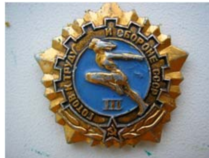
ГТО 3 степени