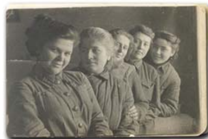
Учеба в оперативной. Апрель 1942г (крайняя справа)