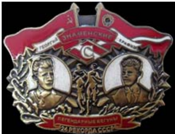
Значок в честь братьев Знаменских