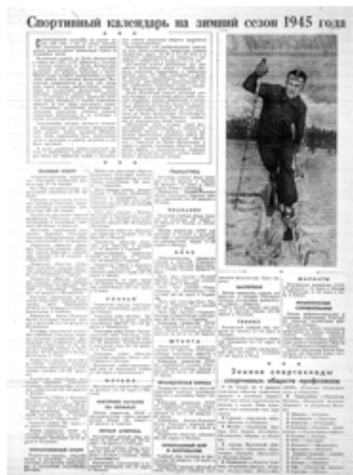
Календарь Московских соревнований на 1945г