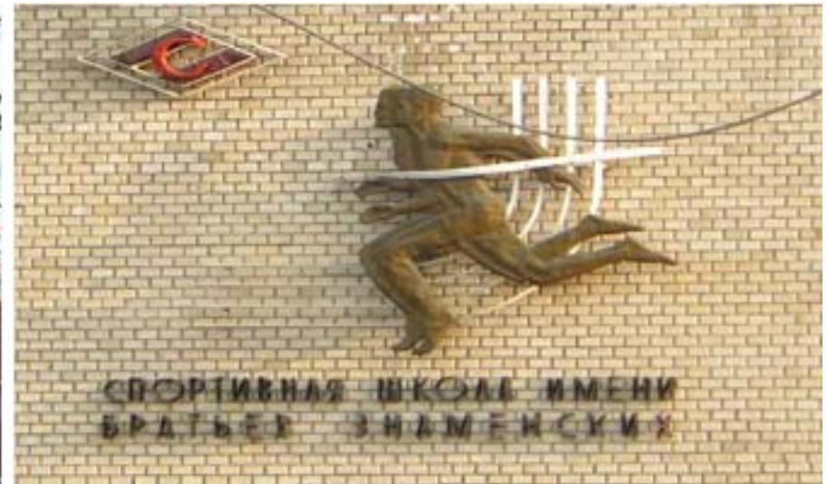
Олимпийский центр братьев Знаменских