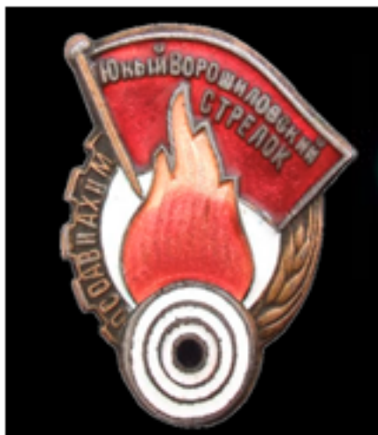
Юный Ворошиловский стрелок