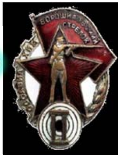
Ворошиловский стрелок 2 степени