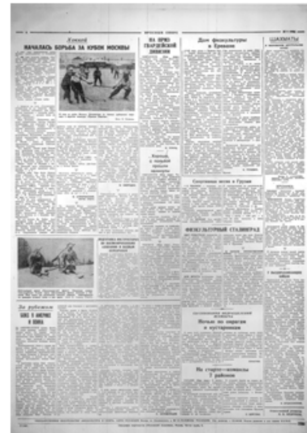
Соревнования во время ВОВ в разных городах.