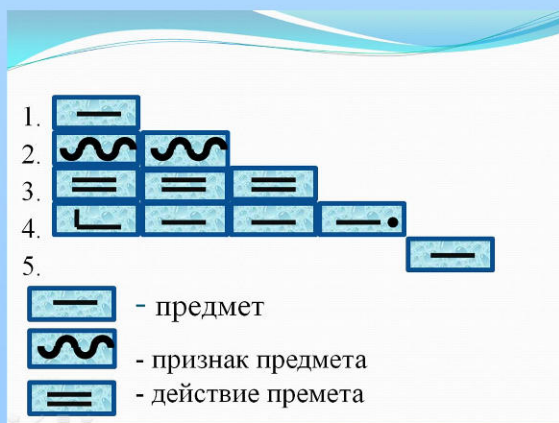
Рис.1 Схема составления синквейна.

Цель: обогащать, систематизировать словарный запас.