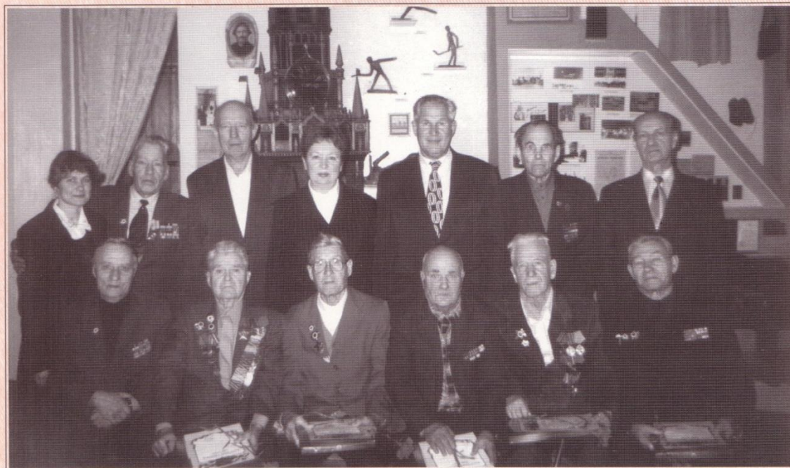
Ветераны Великой Отечественной войны 1941-1945 годов на встрече с руководством города