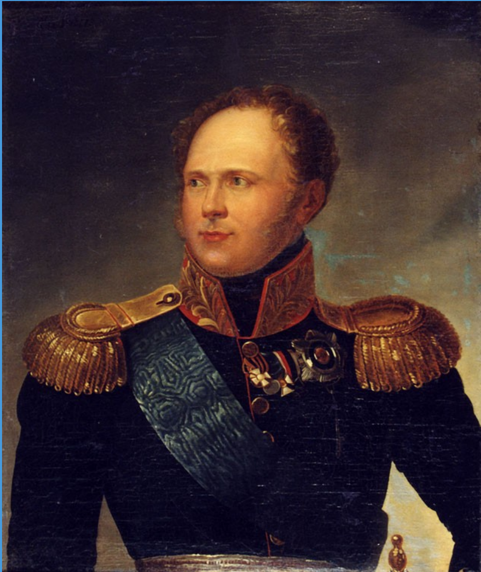
Александр I (1800-1825гг)

Первый русский император, который поручил разработать проект конституционных преобразований