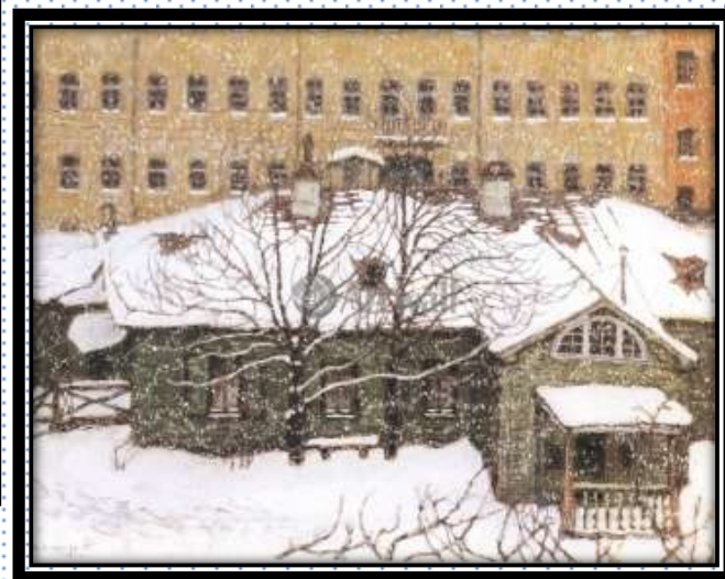
Картины из экспозиции нашего музея