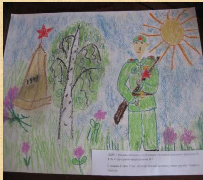
Соня С. «Солдат пришёл к обелиску».