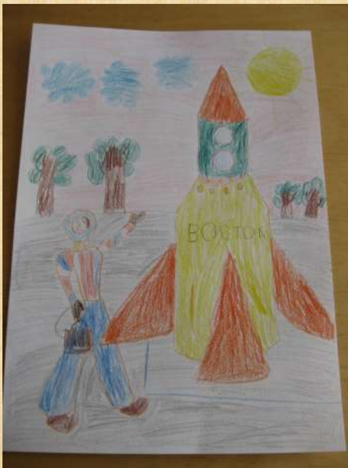
Соня С. «Космонавт готов к полёту».