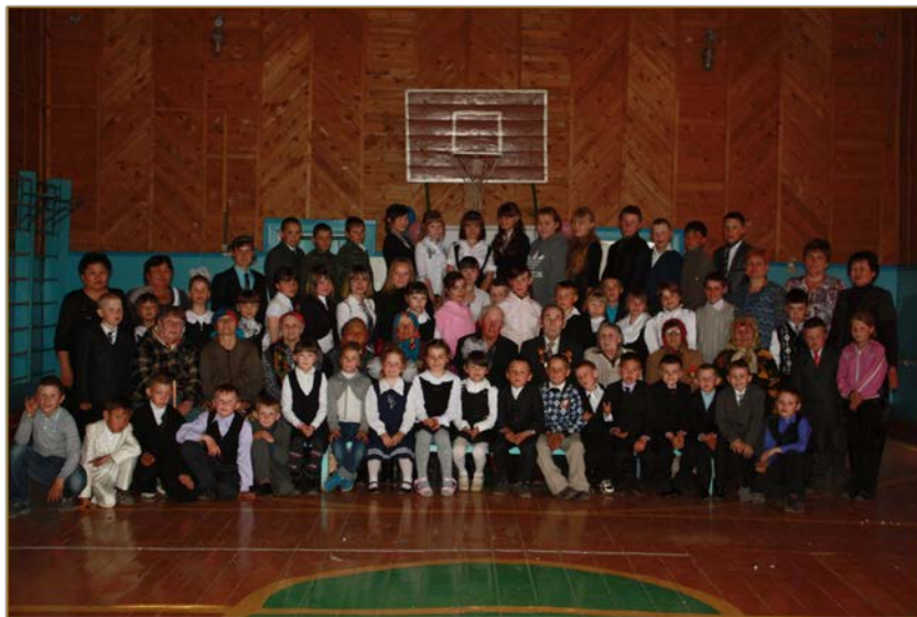
9 мая 2013 год. Встреча учащихся МБОУ «Комсомольская СОШ» с тружениками тыла и детьми войны.