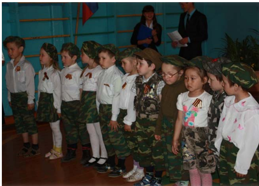
Поздравление воспитанников детского сада