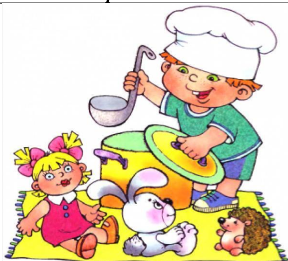
Центр активности «Сюжетно-ролевых игр»

Материалы оборудование: Разные виды конструктора мелкий (настольные), крупный (напольный) строительный материал и лего и др. Разные виды транспорта: наземный, водный, воздушный Дорожные знаки. Альбомы: «Разные виды домов», «Разные виды мостов». Природный и бросовый материал: крышки, пробки, перья, ракушки, шишки, орехи, солома, мочало, камни, палочки, и др. Столярная, слесарная мастерская с различными инструментами и материалом: молоток отвёртка, рубанок, пассатижи, шведский ключ, рожковые ключи, гвозди, болты и др.