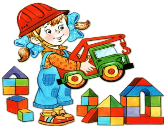
Центр активности «Строительный»

Цель: приобщение к конструированию, развитие интереса к конструктивной деятельности. Воспитывать умение работать коллективно, объединять свои поделки в соответствии с общим замыслом.