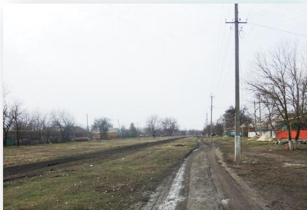
Это моя улица

Как я облагораживаю свою родную станицу? Недавно у нас в школе про- ходила акция: «Помоги птицам».