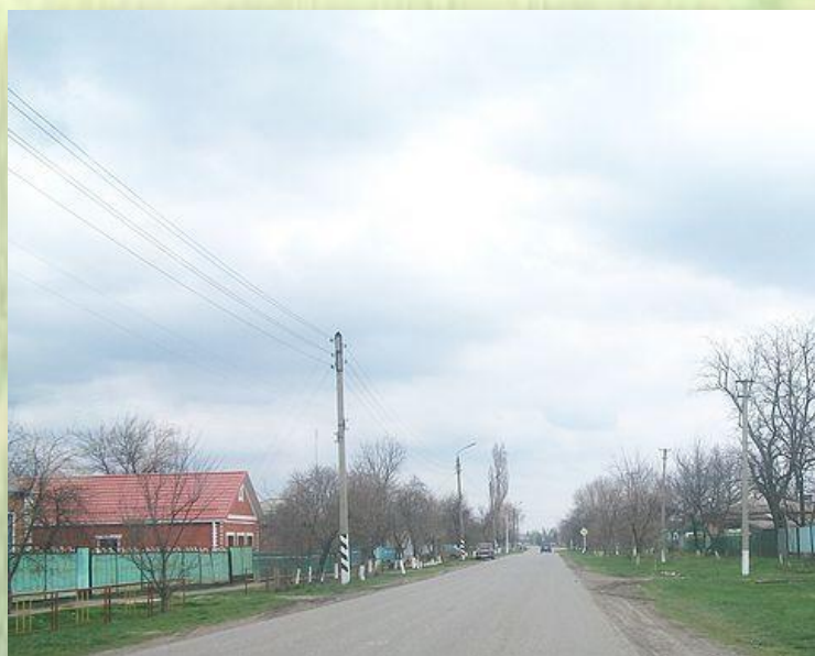
Улицы нашей станицы