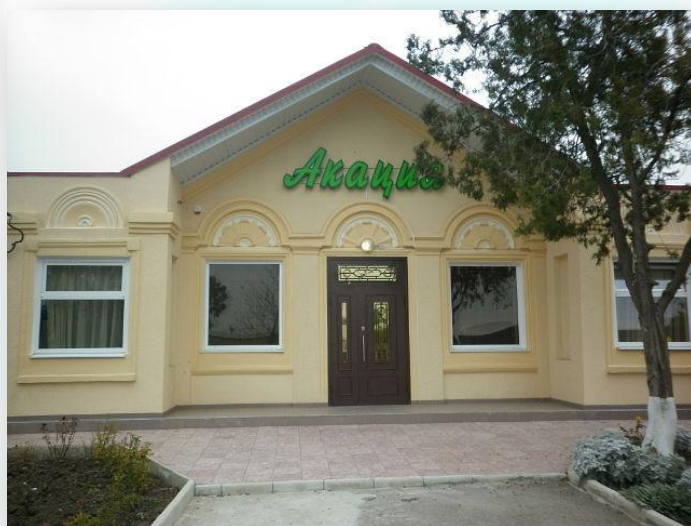
Это кафе «Акация»