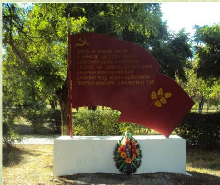
Памятник Шарабурко Е.М.