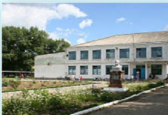
А это второй мой дом, моя родная школа, я пошла в нее 1 сентября 2013 года