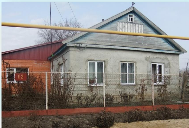
Это мой дом