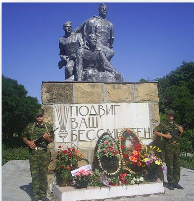
Это памятник погибшим