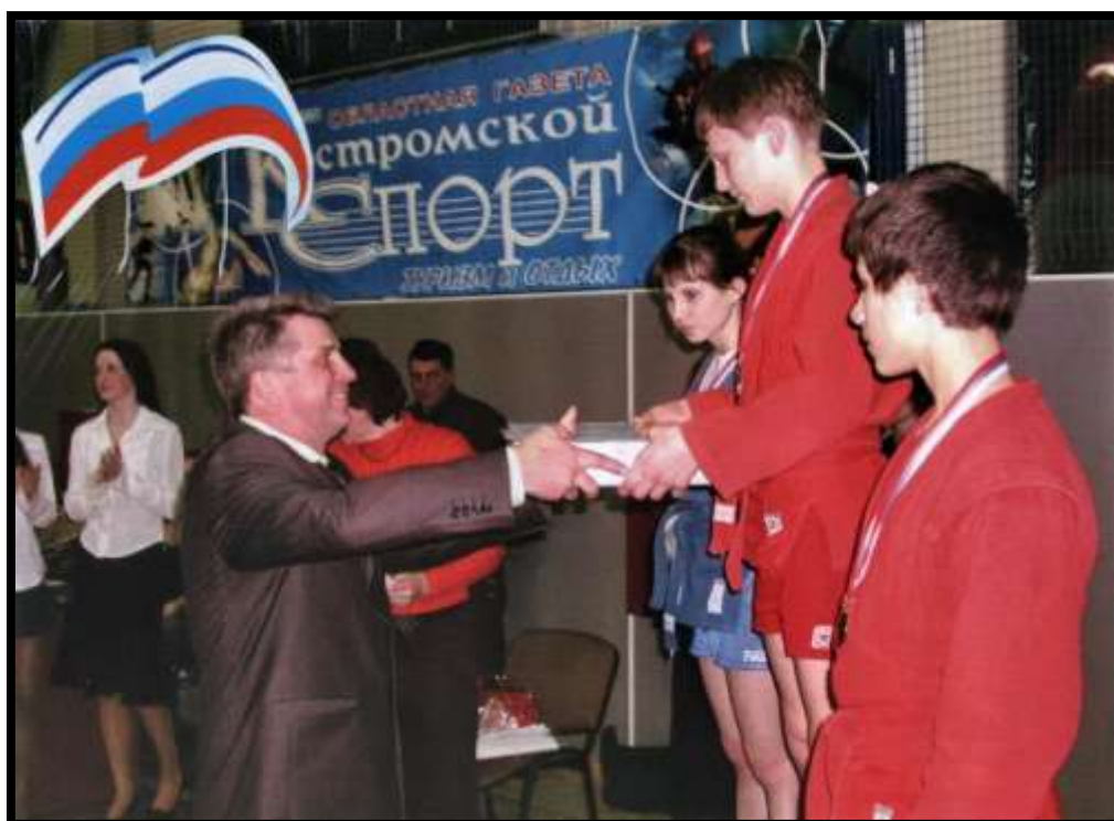
Вручение награды спортсменам под Государственным флагом в спорткомплексе города Волгореченск