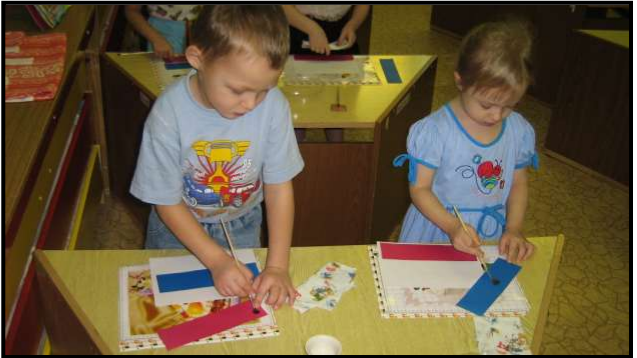
Выполнение аппликации Государственного флага.