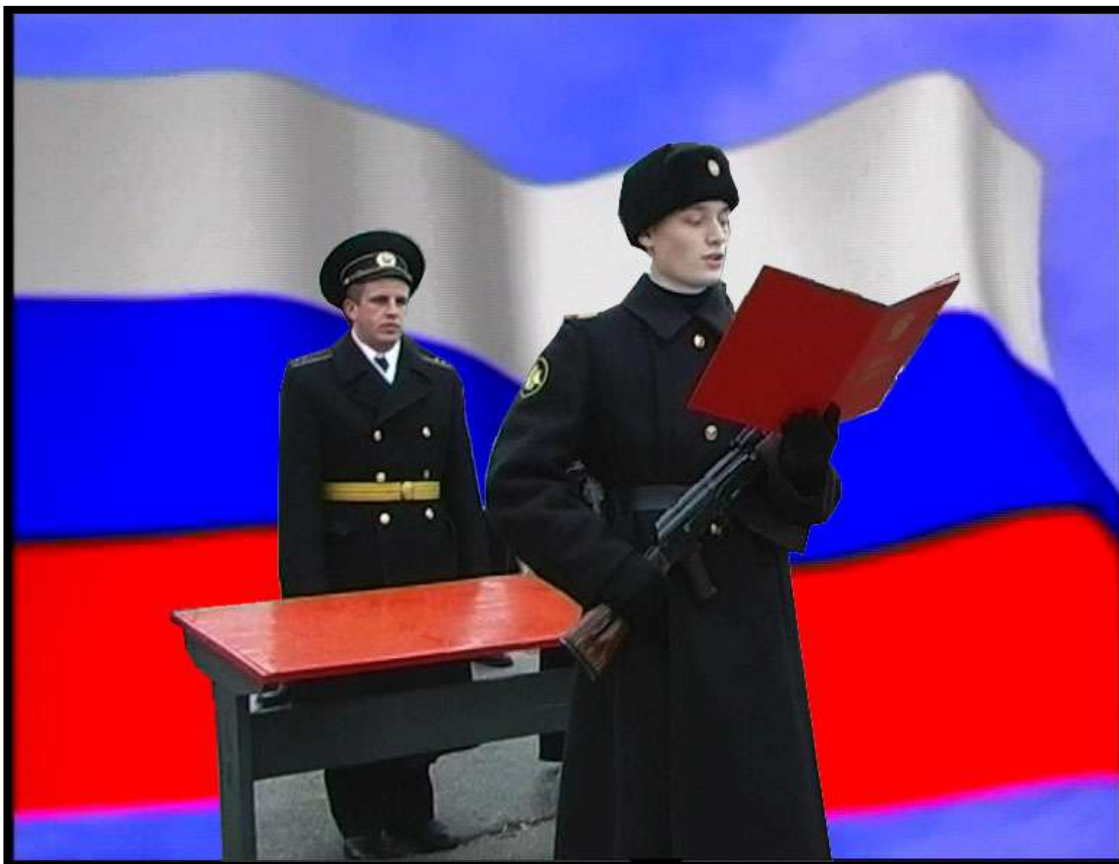
Принятие присяги под Государственным флагом матросом - волгореченцем