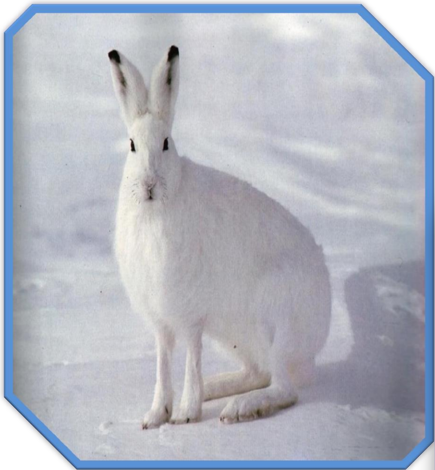
Заяц летом и зимой