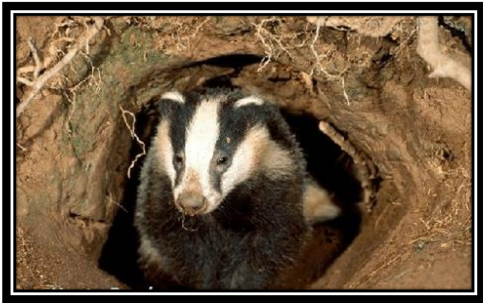
Барсук спит в своей норе