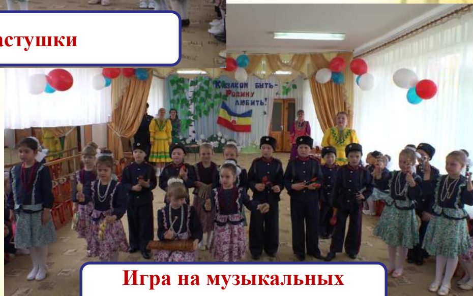
Игра на музыкальных инструментах