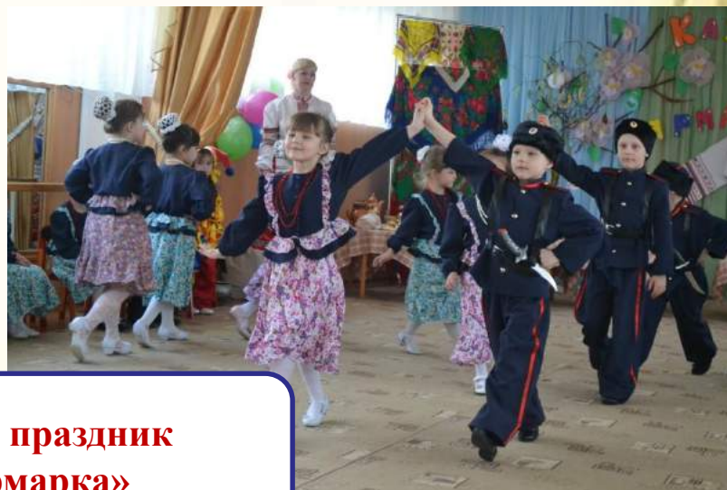
Фольклорный праздник «Казачья ярмарка»