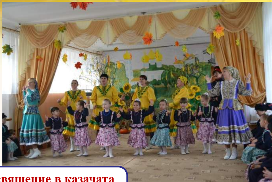
Праздник-посвящение в казачата «Возрождение казачества – это вовсе не ребячество»