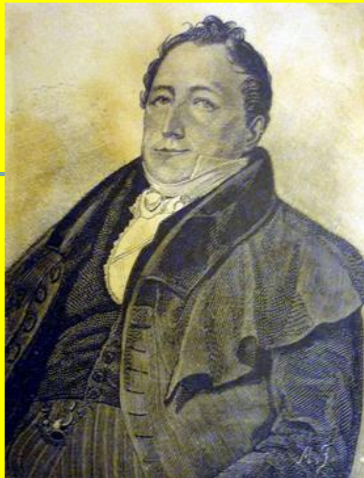
Сергей Львович Пушкин Отец поэта