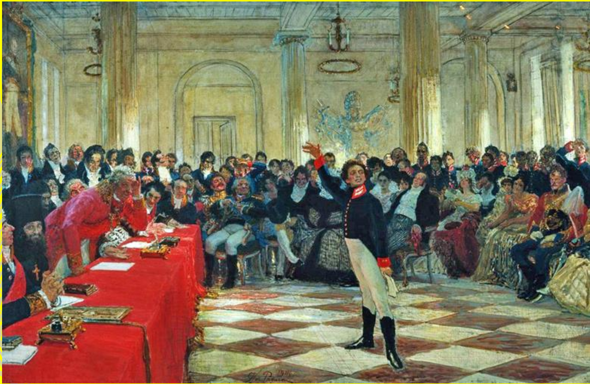
Пушкин на лицейском экзамене в Царском Селе