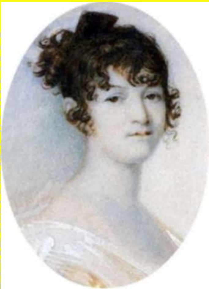
Надежда Осиповна Ганнибал Мать поэта