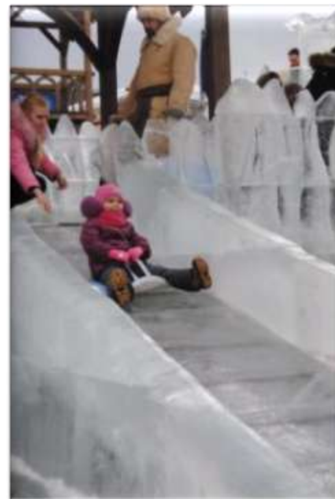
ПРОВОДЫ РУССКОЙ ЗИМЫ. ГОРОД МОСКВА.