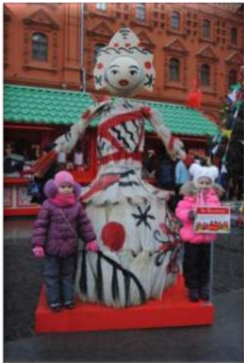
СТЕЛЛА ВАРДАНЫН АНГЕЛИНА ПУЙКА