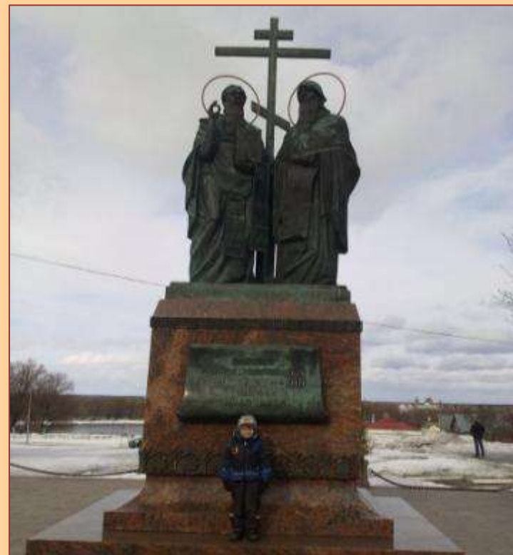
Я с мамой и братом были в г. Коломне. Мы гуляли по Соборной площади, где много храмов. Там же стоит памятник святым людям, которые придумали азбуку, Кириллу и Мефодию. Я выучил уже почти все буквы.