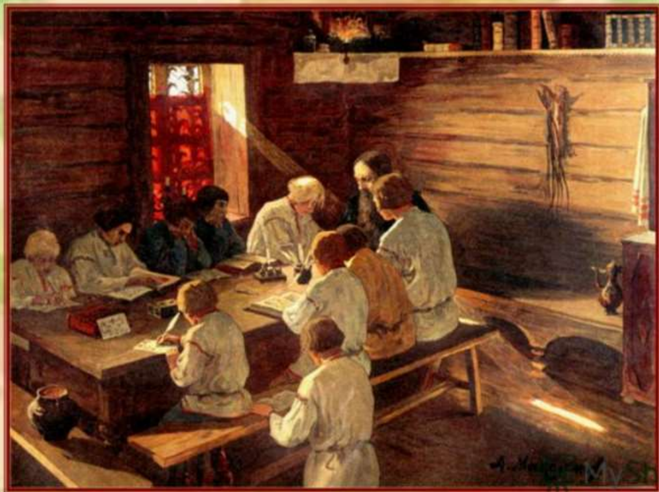
А.Максимов. "Книжное научение".

Истоки русской школы - в Древней Руси. Князь Владимир велел "собирать у лучших людей детей и отдавать их в обучение книжное".