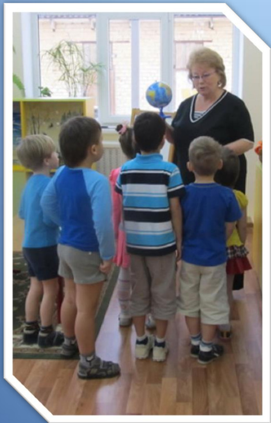
Беседа о воде. Рассматривание глобуса.