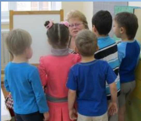
Игра «Четвёртый лишний»