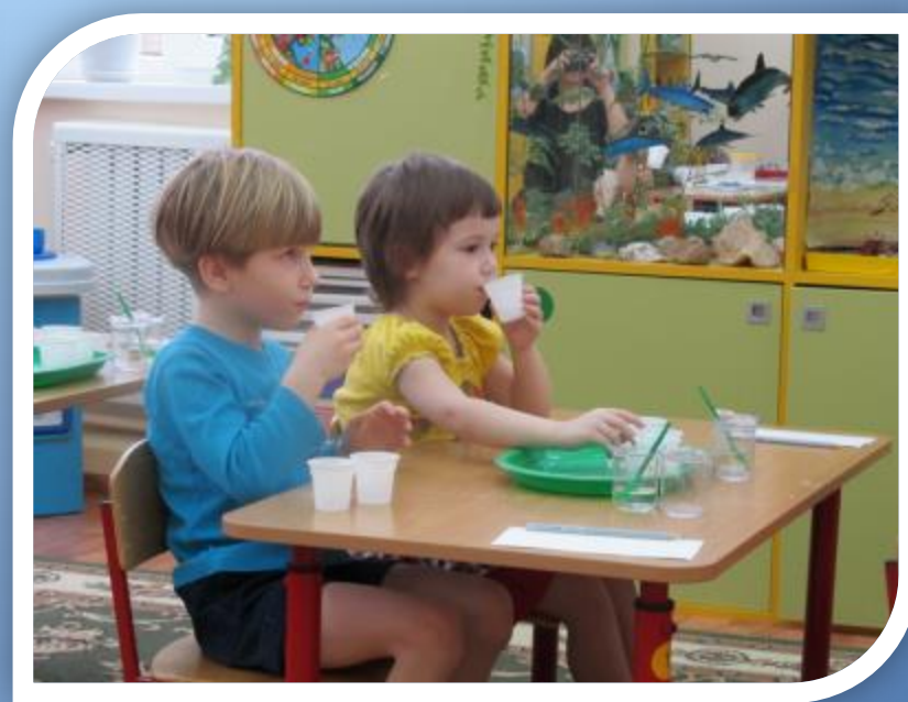
Стакан № 4 – вода безвкусная.