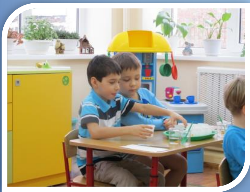
Стакан № 3 – вода сладкая