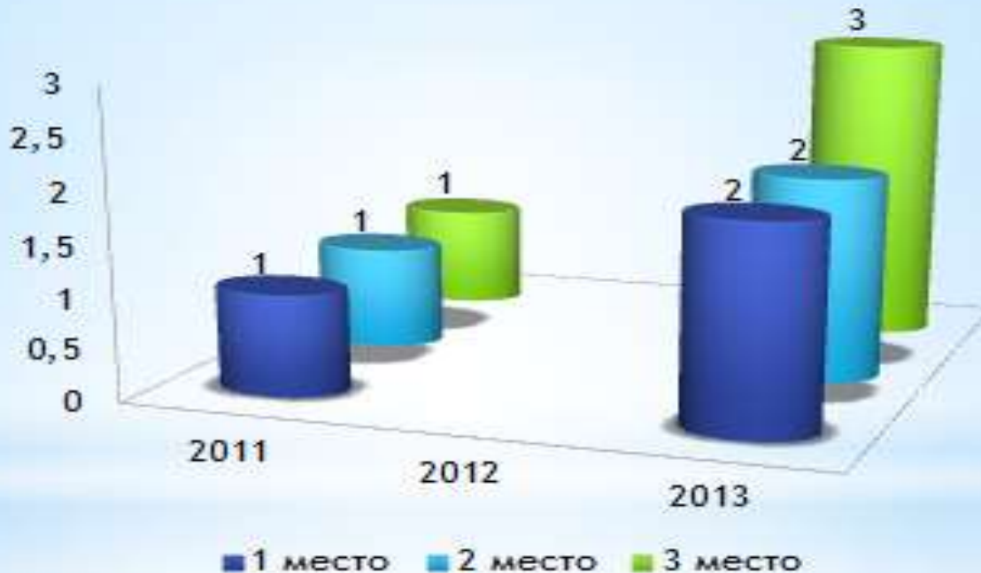
Динамика победителей и призеров муниципального этапа Всероссийской олимпиады школьников по годам

Протокол , сайт гимназии // http://86gmz-sov.edusite.ru