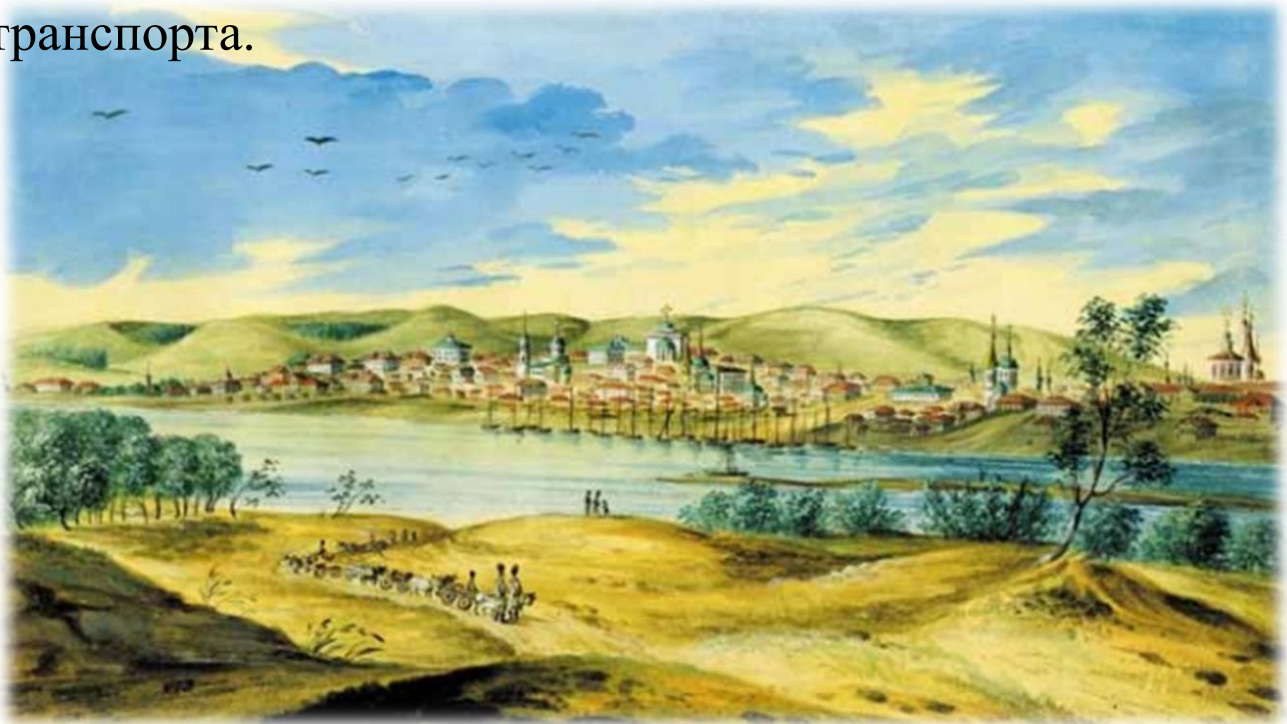
Вид на Саратов с Заволжской стороны. Акварель 1830г.

В разных местах города располагались салотопленные и кожевенные мануфактуры, причинявшие своим запахом большие неприятности окрестным жителям. Берег Волги был занят огромными рыбными лабазами саратовских и иногородних купцов. За Глебучевым оврагом тянулись соляные амбары. А в самом овраге и вдоль него находились небольшие кирпичные предприятия и кузнецы. За городом ( в районе нынешних улиц Сакко и Ванцетти и Пушкинской) размещались мануфактуры, вырабатывавшие канаты и верёвки для волжского и гужевого транспорта.