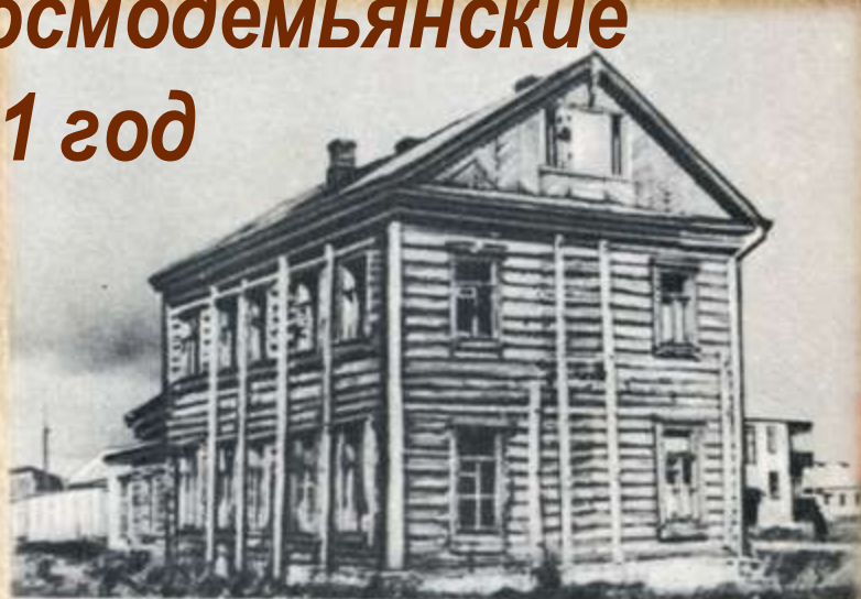
Дом, в котором жила Зоя с 1932 по 1941 год (Александровский проезд Тимирязевского района).

Обелиск Героям Советского Союза Зое и Александру Космодемьянским на месте их дома в районе Коптево