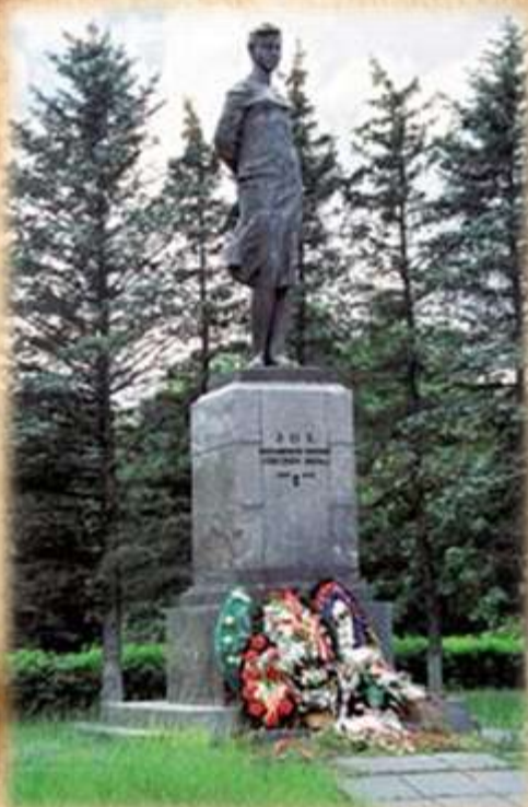
Памятник на 86 км Минского шоссе близ деревни Петрищево