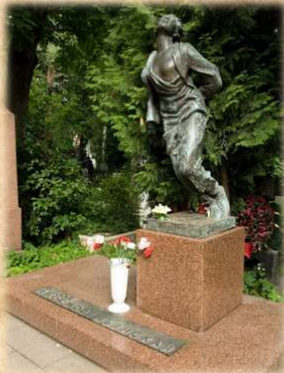
Памятник на Новодевичьем кладбище