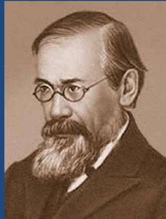
Василий Осипович Ключевский 1841-1911