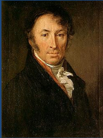
Николай Михайлович Карамзин, 1766-1826