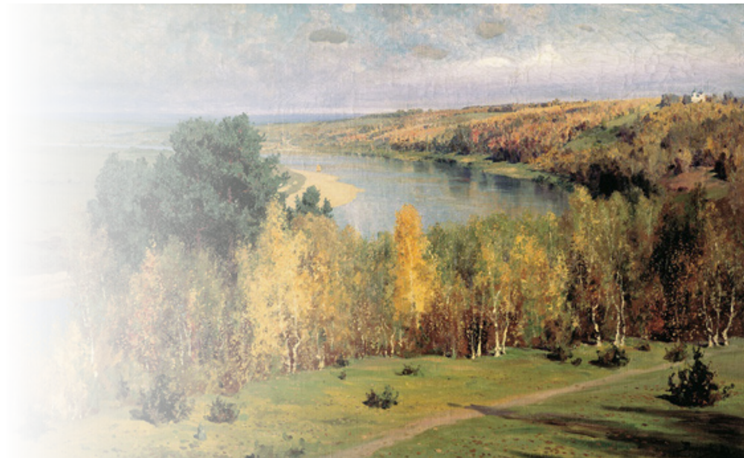
Василий Поленов «Золотая осень»