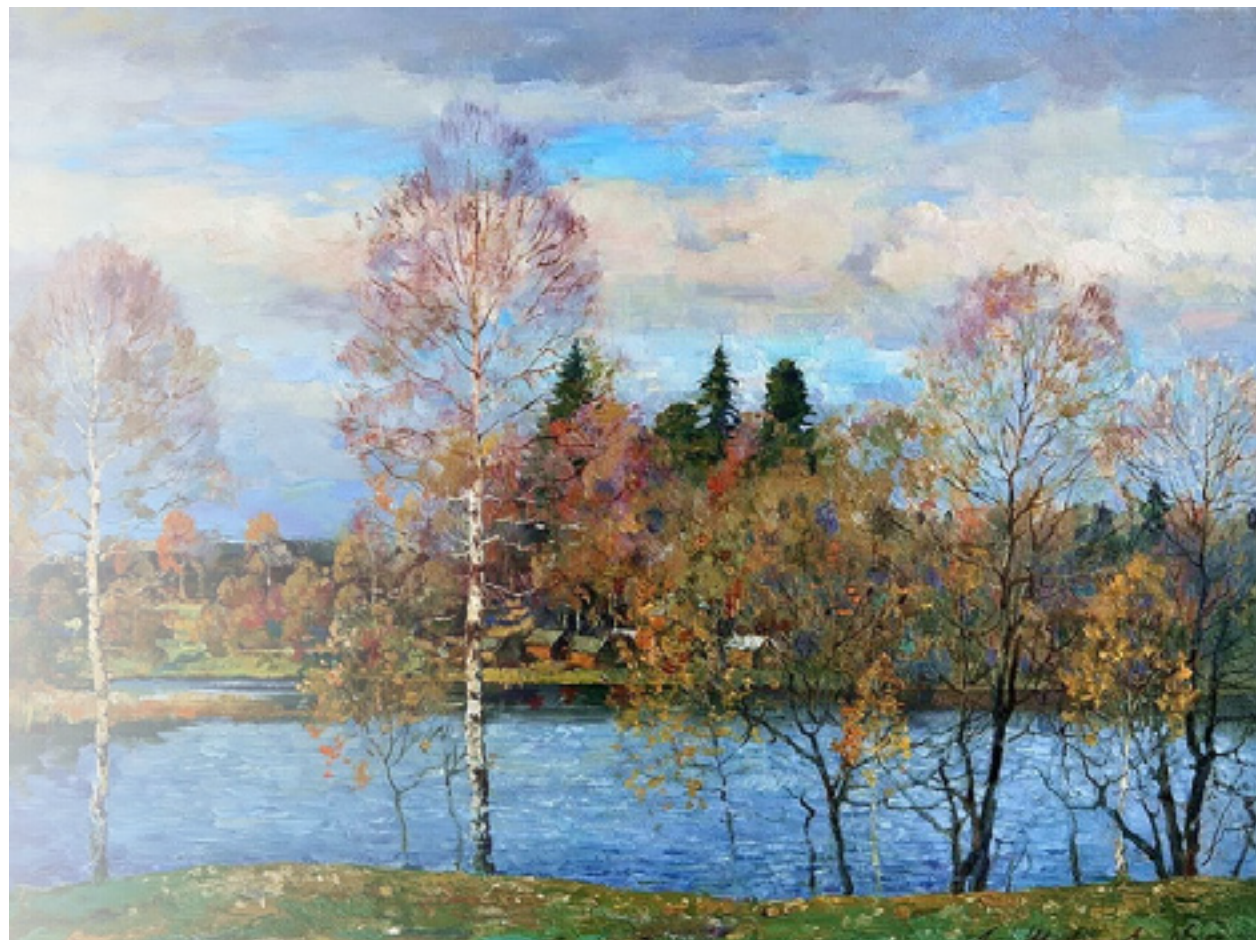
Александр Шевелёв «Осенний пейзаж»