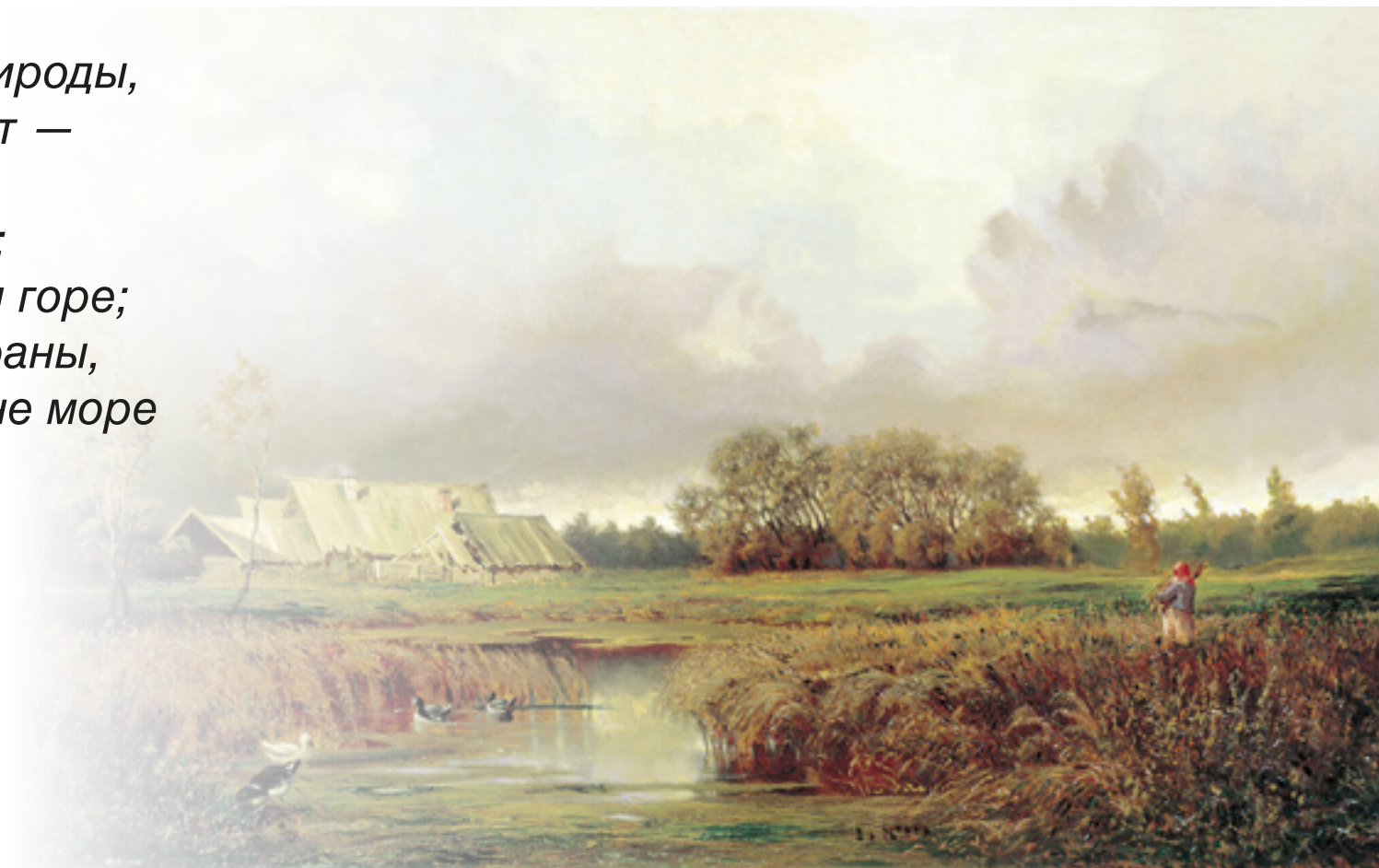
Волков «Болото осенью»