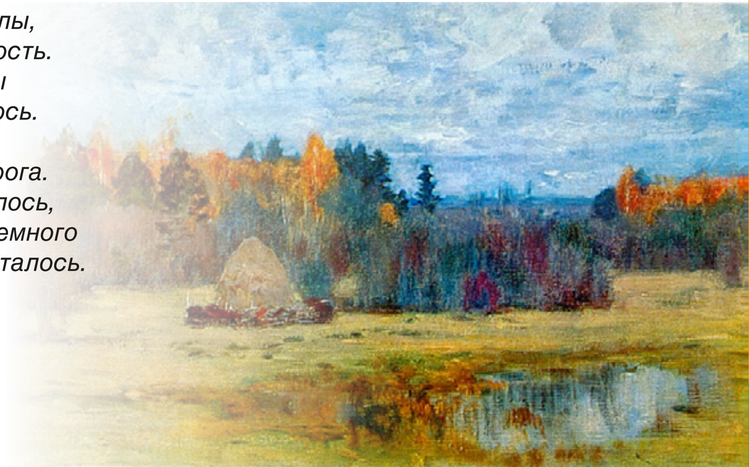
Исаак Левитан «Поздняя осень»