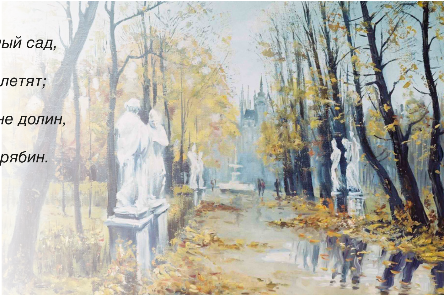
Виталий Жердев «Осенний парк»