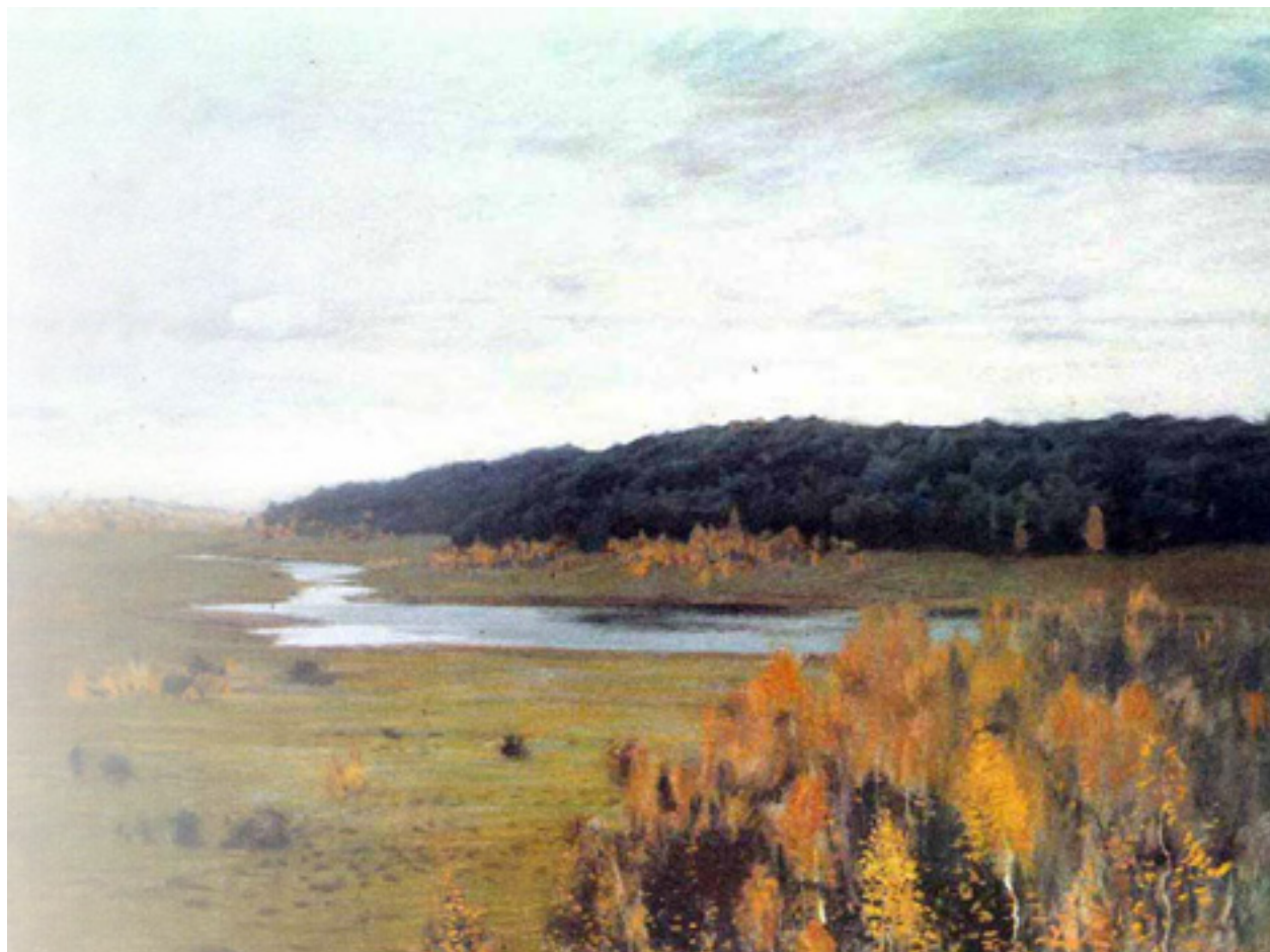
Исаак Левитан «Долина реки»