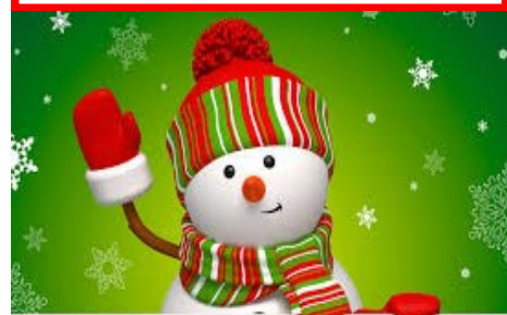
Редактор: воспитатель Шупшина С.В.