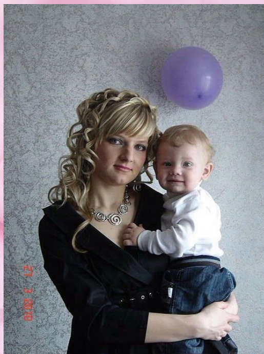
А ЭТО Я! СОВСЕМ МАЛЫШ...