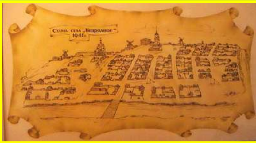
Схема села Безродного