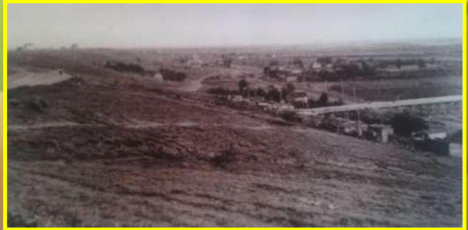
Верхняя Ахтуба, с. Безродное. Слева вдали здание старой школы. 1950 г.