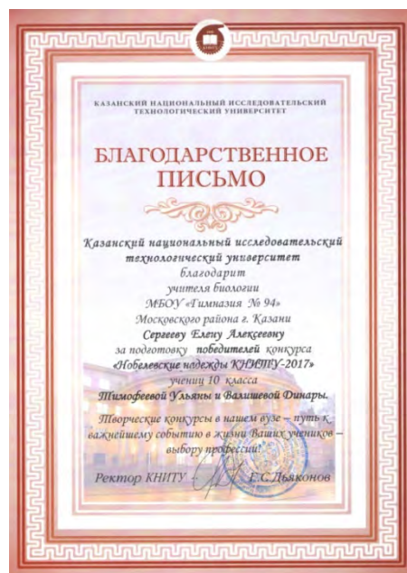
X Конкурс научно-исследовательских и творческих работ «Нобелевские надежды КНИТУ – 2017»