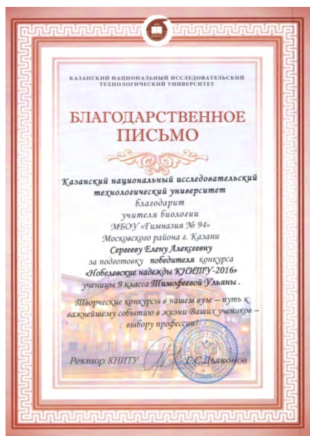
IX Конкурс научно-исследовательских и творческих работ «Нобелевские надежды КНИТУ – 2016»