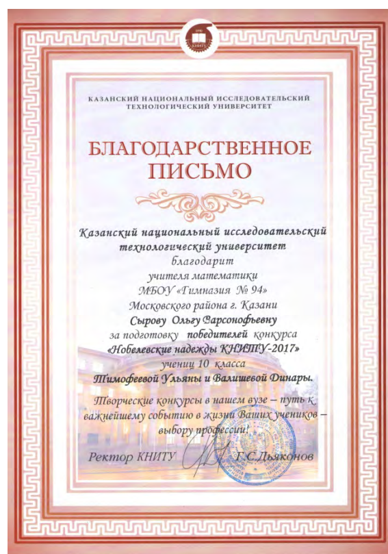
X Конкурс научно-исследовательских и творческих работ «Нобелевские надежды КНИТУ – 2017»