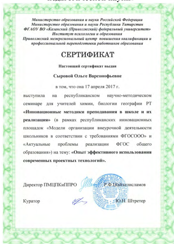
Республиканский научно-методический семинар для учителей РТ «Инновационные методики преподавания в школе и их реализация»