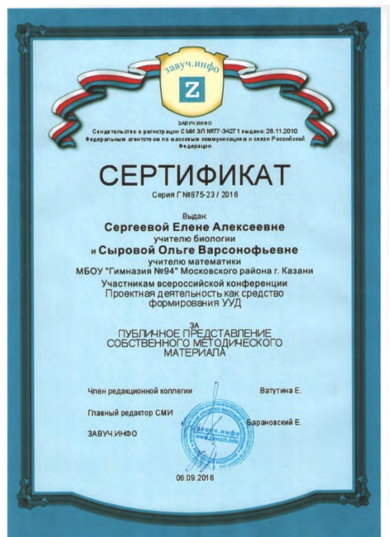
Всероссийская конференция «Проектная деятельность как средство формирования УУД»