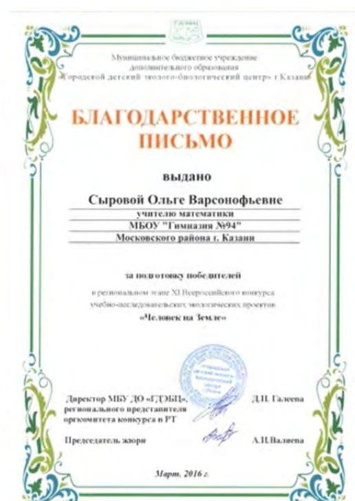
Региональный этап XI Всероссийского конкурса учебно-исследовательских экологических проектов «Человек на Земле»