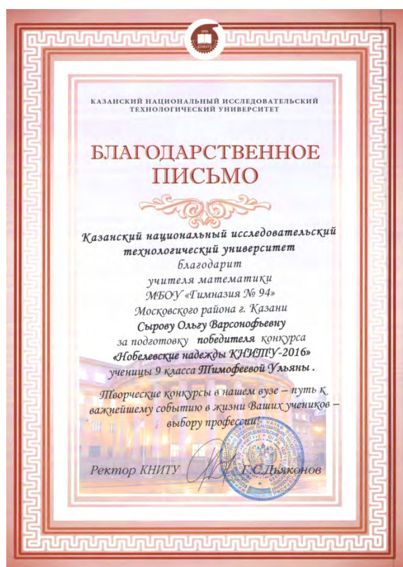
IX Конкурс научно-исследовательских и творческих работ «Нобелевские надежды КНИТУ – 2016»