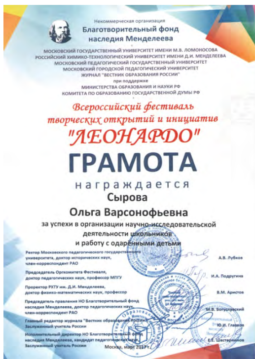
Всероссийский фестиваль творческих открытий и инициатив «Леонардо», Москва