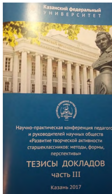
Публикация материала в сборнике тезисов II Всероссийской (XVIII Поволжской) научной конференции учащихся им. Н.И.Лобачевского