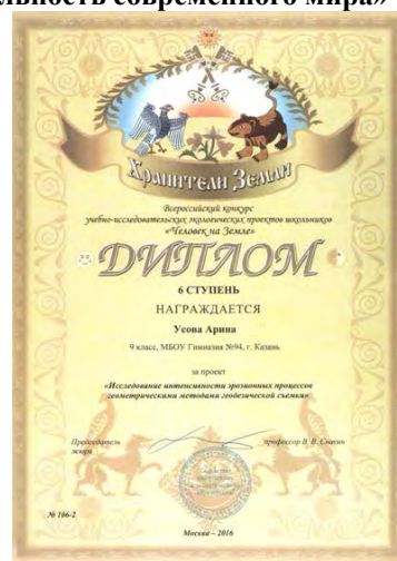
Федеральный этап XI Всероссийского конкурса учебно-исследовательских экологических проектов «Человек на Земле», дипломы «Хранители Земли», 2016 г.