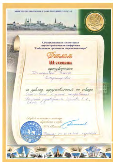
X Республиканская научно-практическая конференция учащихся «Глобализация – реальность современного мира», призер, 2016 г.