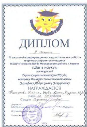
III школьная конференция исследовательских работ и творческих проектов «Шаг в науку», призер, 2015 г.

Исследовательский проект «Исследование интенсивности эрозионных процессов геометрическими методами геодезической съемки»