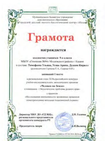
Региональный этап XI Всероссийского конкурса учебно-исследовательских экологических проектов «Человек на Земле», победитель, 2016 г.