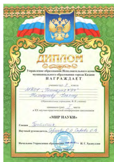
Открытая городская научно-практическая конференция учащихся «Мир науки», победитель, 2016 г.