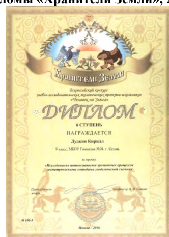
Федеральный этап XI Всероссийского конкурса учебно-исследовательских экологических проектов «Человек на Земле», дипломы «Хранители Земли», 2016 г.