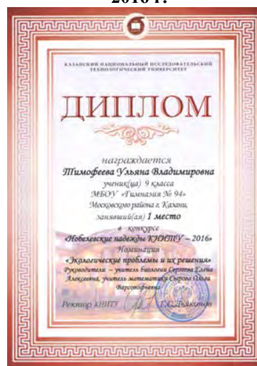
IX Конкурс научно-исследовательских и творческих работ «Нобелевские надежды КНИТУ – 2016», победитель, 2016 г.