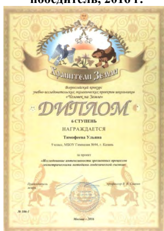
Федеральный этап XI Всероссийского конкурса учебно-исследовательских экологических проектов «Человек на Земле», дипломы «Хранители Земли», 2016 г.