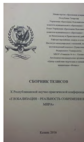
Публикация тезисов в сборнике X Республиканской научно-практической конференции учащихся «Глобализация - реальность современного мира» - 2016